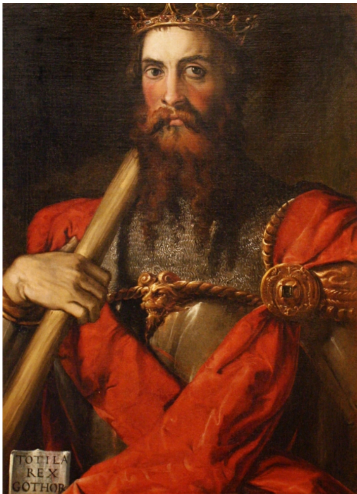
Fig. 5 – Francesco Salviati, Totila , huile sur toile, vers 1549, Côme, Pinacoteca di Palazzo Volpi.