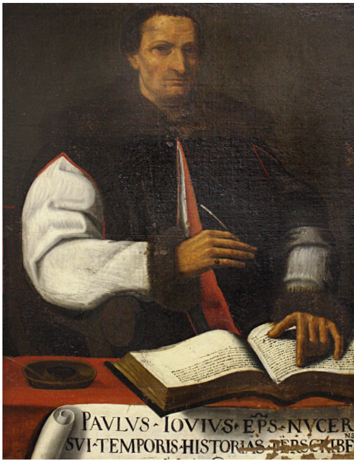
Fig. 2 – Portrait peint de Paolo Giovio.