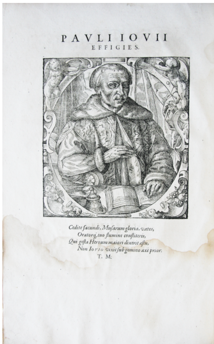
Fig. 3 – Portraits gravé de Paolo Giovio.