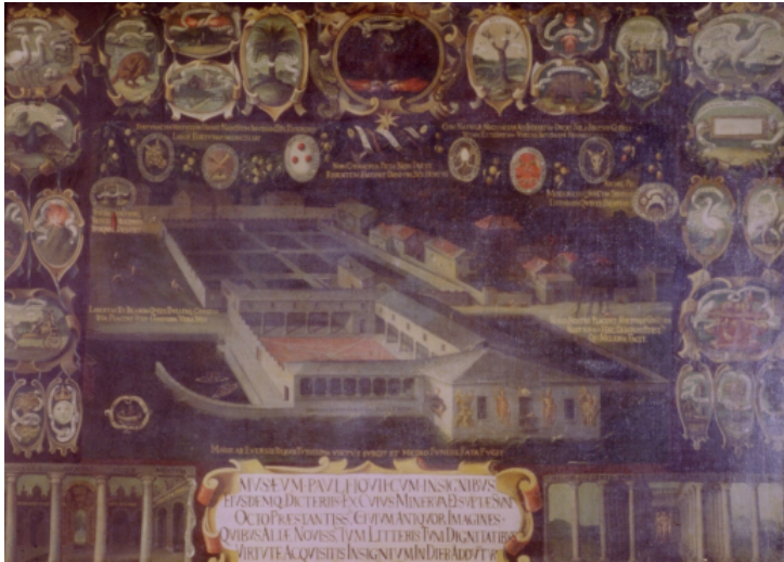
Fig. 1 – Anonyme, Vue du Museo , huile sur toile, Côme, Pinacoteca di Palazzo Volpi.