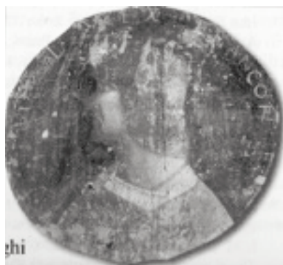
planche n° 9

par les princesses Claude de France et Lucrece Borgia, qui y associèrent très vraisemblablement leurs époux, l'échange s'inscrivait dans ces mêmes protestations d'affection et d'amitié, fruits d'une alliance diplomatique véritable. Dans sa demande, la duchesse de Ferrare prenait ainsi en compte les nouvelles réalités dynastiques et politiques françaises, elle qui désirait avoir également le portrait de « Madame d'Alençon » 132 . La véritable « trinité royale », au sein de laquelle la reine Claude avait succédé à Louise de Savoie 133 , commençait à