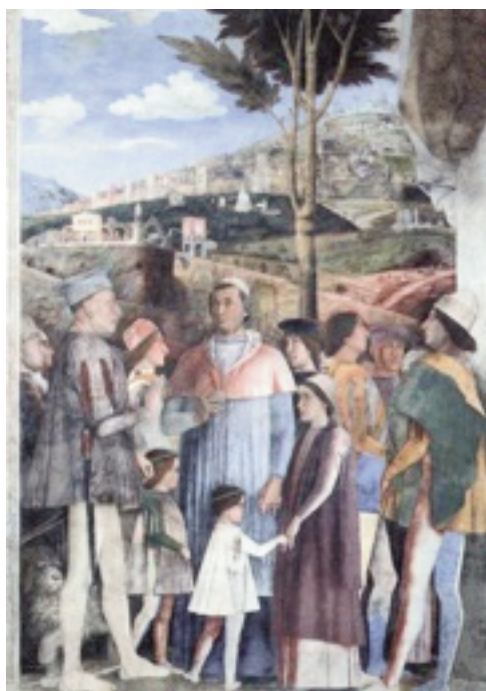
planche n° 11

voulu par Cosme de Médicis, l'on a pu ainsi identifier deux des hôtes et alliés accueillis par le Pater patriae en avril 1459 à l'occasion de la venue de Pie II à Florence : le duc de Milan Galeazzo Maria Sforza et le seigneur de Rimini Sigismond Malatesta (†1468) 140 . Douze ans plus tard, sans doute vers 1471, le petit-fils de Cosme, Laurent le Magnifique, plaça pareillement de part et d'autre de son lit les portraits de ses deux alliés, dont l'un au moins est conservé, celui du même Galeazzo Maria Sforza peint par Piero Pollaiuolo ( Offices , Florence), qui illustre la protection du puissant duc de Milan pour le jeune prince 141 , portrait placé en vis-à-vis de celui de Frédéric de Montefeltre duc d'Urbino et condottiere attaché à la république de Florence, effigie dis-