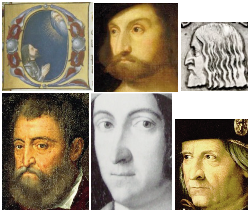
planche n° 3

Une telle identification est confortée par la datation stylistique proposée par Joannides : daté de 1515-1516, le portrait d'un tel personnage est d'autant plus probable que ce fut précisément à partir de l'hiver 1516 (du 13 février au 22 mars au moins 14 ) que des liens tangibles entre le jeune Titien et Alphonse d'Este se nouèrent. En retour, l'attribution au peintre vénitien s'en trouve également assurée, si besoin : la probabilité qu'il s'agisse d'un tableau de Titien est en effet d'autant plus forte que le personnage représenté se trouve être le patron du peintre au moment de la datation proposée 15 . Car si l'artiste Jean Gigoux avait