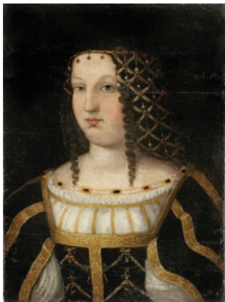
planche n° 6

L'accord, presque général, à inscrire ce dernier portrait dans le sillage de Bartolomeo Veneto, sans lui accorder cependant (à l'exception ancienne de Benenson) le statut d'original 28 , a ainsi conduit, pour des raisons de vraisemblance, à dater la copie nîmoise de la décennie 1510, et son original de « la seconde moitié de la première décennie du [XVI e ] siècle », voire, plus précisément, « probablement vers la fin de la première décennie du siècle » 29 . Compte tenu de sa qualité, légèrement inférieure à celle des tableaux de la main de Bartolomeo Veneto 30 , la copie ne pouvait en effet avoir été exécutée qu'une fois le maître parti de Ferrare ; or, la présence à Milan de celui-ci, sans doute aux côtés de son mécène Hippolyte I er d'Este, est attestée dès 1511 31 .