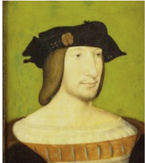
planche n° 4

en son temps identifié Alphonse d'Este comme sujet et Titien comme artiste (annexe 1, col. 1 et 6), ce n'était visiblement que grâce à son seul « œil de peintre ». La critique, délaissant la question de l'identification, a depuis attribué durablement l'œuvre à Titien en raison d'arguments d'ordre stylistique (col. 6), qui ont conduit Paul Joannides à cette datation. L'identification d'Alphonse d'Este sous l'apparence de L'homme aux traits anguleux conforte, par un argument cette fois d'ordre historique, attribution et datation. Si l'on s'étonnait, enfin, de l'aspect fort peu ducal en apparence d'un personnage dépourvu de tout attribut du pouvoir, on pourrait faire valoir l'un des tout premiers portraits de François I er , datant de son avènement contemporain (pl. n°4, sans doute d'après Jean Clouet – musée Condé, Chantilly –) 16 , représentation qui renvoie à une semblable et apparente simplicité princière, bien que leur statut semble traduit notamment par un couvre-chef, dont l'état du tableau bisontin ne permet pas de se rendre parfaitement compte, et, à y mieux regarder, par le luxe de vêtements ornés dans les deux cas de fourrure. À ce dépouillement presque trompeur s'ajoute, pour le portrait du duc, un argument d'ordre stylistique : ce que Paul Joannides a pu désigner, parlant du Titien de ces années 1512-1518, com-