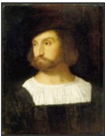
planche n° 2

lettres de la duchesse, plus particulièrement dans celle du 11 août 1516. Demeure la question des éventuels portraits des deux princes, François I er et Alphonse d'Este. Comme d'une part, Lucrece emploie à deux reprises le pluriel pour évoquer les portraits français, et que d'autre part, l'on conçoit assez mal qu'un tel échange n'ait pas concerné l'allié véritable du roi, le duc Alphonse d'Este, on penche plutôt vers un ensemble de portraits princiers comprenant tant celui du duc que celui du roi. La correspondance conservée ne les mentionnant pas, il faut, pour eux comme pour ceux au sujet connu, solliciter d'autres sources documentaires.