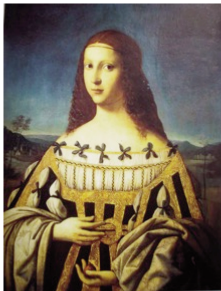
planche n° 5

Les datations proposées par le passé pour le tableau nîmois découlaient de l'approche choisie par les différents historiens d'art : attribution du tableau 22 , âge supposé de Lucrece († 24 juin 1519), ou encore l'utilisation de ce dernier critère (l'âge façonnant l'apparence) pour comparer le portrait nîmois à d'autres tableaux tenus pour des versions distinctes d'un même et unique portrait 23 . Le débat critique, en effet, a été dominé par le statut (original ou copie) à accorder au portrait nîmois, et par l'attribution de l'original, que ce dernier fût donc nîmois 24 ou bien perdu, à Bartolomeo Veneto 25 . Les documents d'archives publiés par Adolfo Venturi avaient en leur temps fait surgir à Ferrare