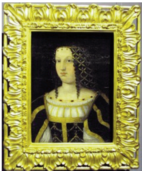
planche n° 1