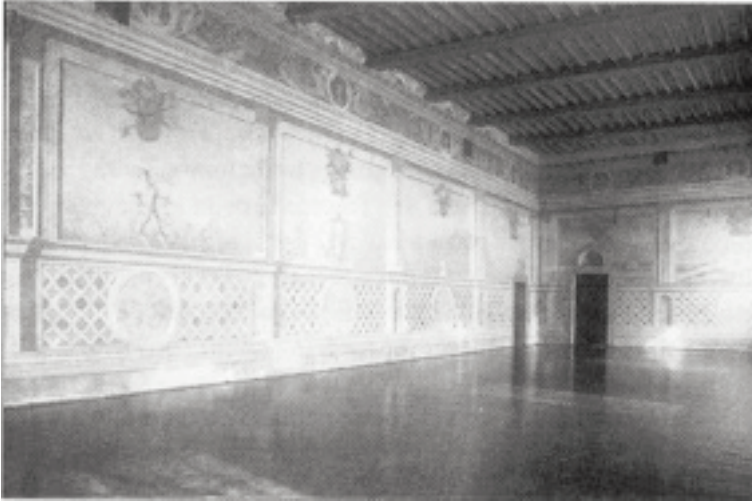
planche n° 10