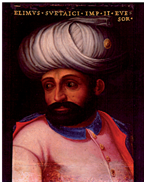
Fig. 7. Anonyme, Portrait de Selīm I er , [1579-1580], huile, Vienne, Kunsthistorisches Museum, collection Ambras

copies qui, en raison de leur origine commune, appellent la comparaison. Entré dans les collections médicéennes à une date imprécise (entre 1552 et 1568 88 ), le portrait du sultan, bien identifié par l'inscription (fig. 6), fut d'abord placé au Palazzo Vecchio dans la Sala del Mappamondo (la guardaroba nuova ) avant de rejoindre en 1587 la galerie supérieure des Offices, aux côtés de plusieurs dizaines de portraits d'hommes pareillement illustres. On a vu comment, dans le portrait ayant appartenu à Paul Jove, le concours de l'inscription et des attributs guerriers prêtés habituellement à ces premiers portraits de sultans, avait permis de célébrer en Selīm le destructeur de l'empire mamelouk. Dès lors qu'attributs (pour la plupart non représentés et inscription ne renvoyaient plus ici à cet événement et