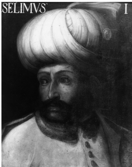
Fig. 6. Cristofano Dell'Altissimo, Portrait de Selīm I er , [[1552-1568 ?], Florence, Galerie des Offices

Il n'en est pas de même, quelques décennies plus tard, du véritable modèle pictural naissant : le portrait que Paul Jove avait fait exécuter. On en connaît, en effet, deux copies, réalisées au sein même du Museo à Côme : celle peinte sur l'ordre et à l'intention du duc Cosme I er de Florence par Cristofano Dell'Altissimo (fig. 6)