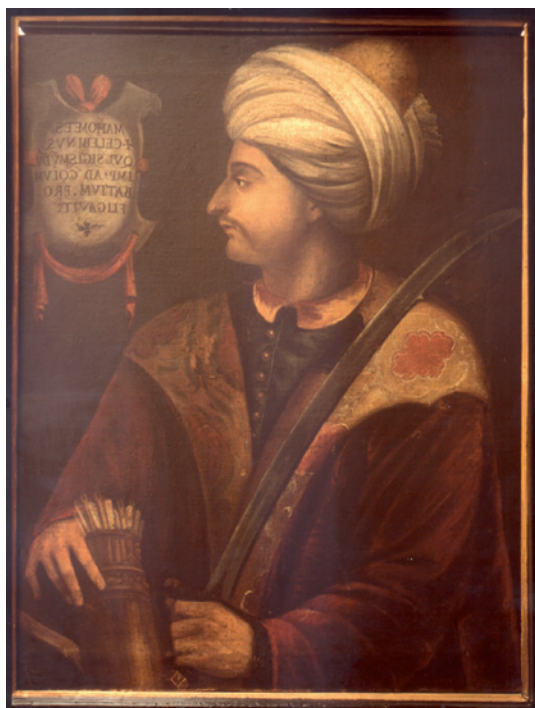
Fig. 4a. Anonyme [École florentine ?], Portrait de Mehmed Ier Çelebi , [1543-1549 ?], huile sur toile, Côme, Museo Archeologico

dont on sait qu'il appartient au Museo ; mais aussi une autre preuve matérielle. Les dimensions du portrait de Selīm sont, en effet, de 99 centimètres par 76,8. L'on sait que lorsqu'il en avait le loisir, Paul Jove décidait de la taille d'un tableau devant orner son Museo ; et le seul portrait de sultan ayant appartenu à Jove et conservé dans une collection publique, celui de Mehmed Ier Çelebi, a des dimensions similaires 35 . Enfin, la datation proposée (milieu XVI e siècle, non au-delà de 1575 36 ) correspond également, pour l'hypothèse « haute », à la date d'arrivée du portrait de Selīm au Museo de Côme (1549 37 ) et par là même à celle de sa probable exécution.