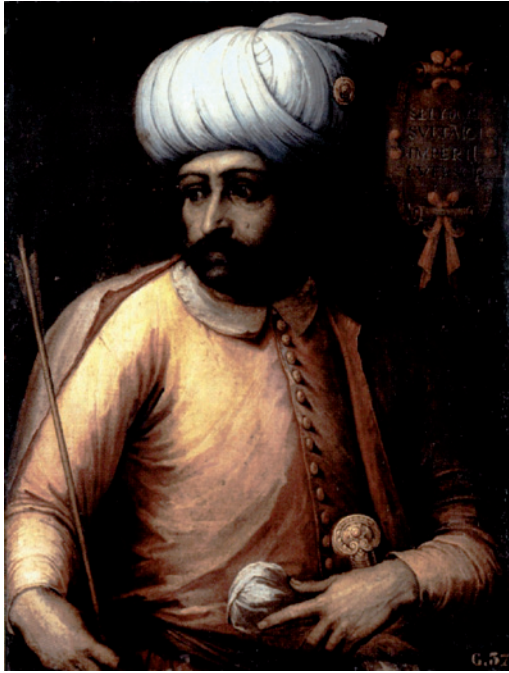
Fig. 3. Anonyme [École florentine ?], Portrait de Selim I er , [1543-1549 ?], huile sur toile, collection particulière, 99x76,8 cm

inédit (passé en vente en 1997 18 ), représente le souverain de trois-quarts, à gauche, et à mi-corps, attributs et thème guerriers conférant son sens au tableau. Un élément, en effet, déterminant est l'inscription peinte dans un cartouche, en haut à droite (fig. 3a).