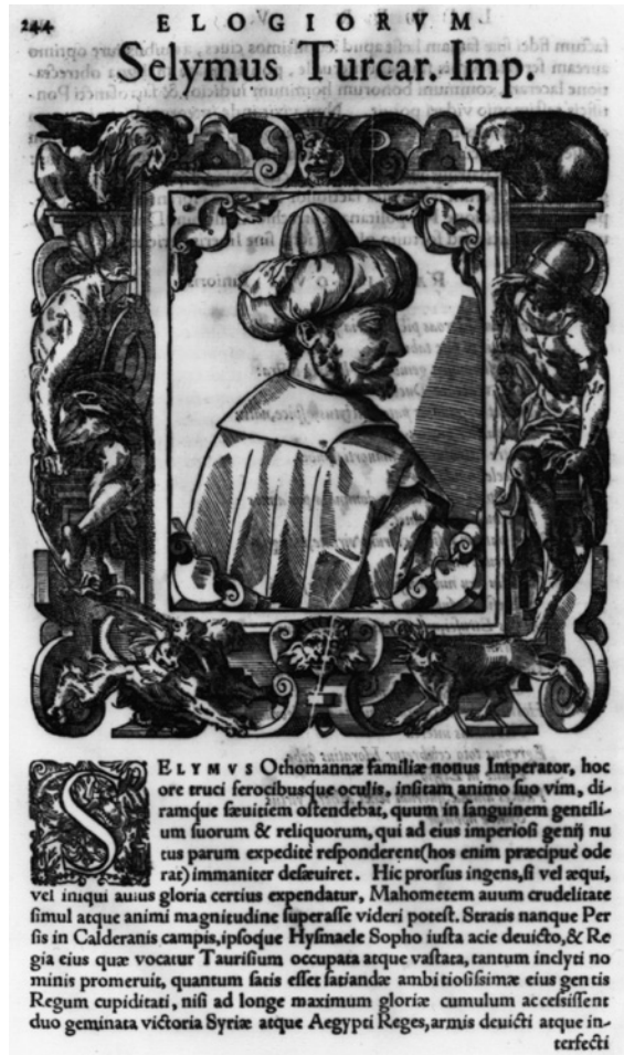
Fig. 5. Thobias Stimmer, « Selymus Turcar.[um] Imp.[erator] », gravure sur cuivre, dans Paolo Giovio, Elogia... , Bâle, Petrus Perna, 1575, p. 244