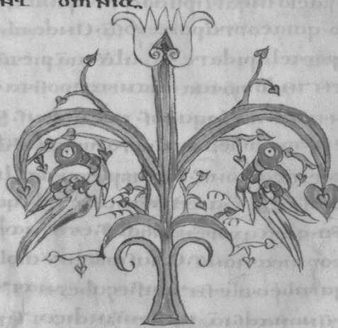
FIG. 1. Eugippe, Excerpta ex operibus sancti Augustini , Paris, BnF, manuscrit latin 2110, fol. 153v, première moitié du VIII e siècle, peinture sur parchemin.

Sed tamen indices domini auxilio. Ipse ergo dominus quis est quid ubi ualeat uxorē concessit. nihil amplius hoc uisus est hoc prescripsit nec per- in licentia. uoluptatis. corrumpit templū eius. quod esse coepit. n. Nam quid ergo hoc dico. apostolus. audite. nescitis quia tēplū dicitur et ipsi dicitur habitatio uobis. hoc dicitur christi. hoc dicitur fidelibus. Nescitis quia tēplū dicitur. et ipsi dicitur habitatio uobis. Si quis tēplū dicit corrumpit et corrumpit illū dicit. uideatis quomodo in uastat non uis corrumpere domū tuā quare corrumpit domum dī Certe non facis ad eum. quod praesentis non uis. Non nescis ergo quia ea dicitur teneat. ille qui se teneat non ruat ab omnia enim peccata hominū a se ad corrumpit ellā per timent. placitū. rā. a se ad facinorosa. nocendi quia dō nocet non pro se in facinorosis in placitis. eū offendit. in corrumpit uis eam. offendit in te illis. facis iniuriā. facis enim iniuriā gratia ipsius doni ipsius. Seruā si haberes uelles. ut seruares tibi ser- uas tuas. Serua tu meliore dno dō. Serua tuā non tu peccis et te. et seruā tuā ille peccit. uis ut seruā tibi. cū quo fac- tuas. et non uis seruare ei. aquo fac tuas. Et ergo cū uis. ut ser- uas tibi. seruā tuas. homo. et tu non uis. seruare dno tuo. facis dō quod tu rapas. non uis. et ergo illā unum. prescriptum. continet. duo illa. duo continent. decem illa. decem. con- tinent omnia.