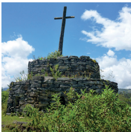
Figura 10. Cruz en la cima del sitio arqueológico de Óllape.

Ahora bien, en los casos de Kuélap, Yálape, Tálape (Pisuquia) y Óllape, es fácil argumentar a favor de su carácter de “poblado con defensas”, pero en los demás esto resulta complicado, abriendo la posibilidad de que no se tratara de asentamientos poblacionales, sino de lugares con otra función. En este sentido, son llamativas las cruces encontradas en las cimas de los restos arqueológicos de Tólape, Órlape y Óllape (Figura 10).