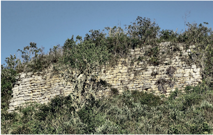
Figura 4. Muro del sector arqueológico Malca o Malcapampa.

vía la hacienda de Kuélap, desde la cual no se pasa por, ni tampoco se ve Malcapampa. Middendorf también retornó por el mismo camino, además de que se desprende de sus descripciones precisas que nunca se desvió a Malcapampa (1895, 213-222). Considerando esto, junto con el documento de linderos de 1818 y los apuntes de Bandelier, en los cuales tampoco figura este otro sector arqueológico –poco llamativo en comparación con las dimensiones de Kuélap–, resulta inverosímil asumir tal serie de equivocaciones por parte de tan destacados investigadores.