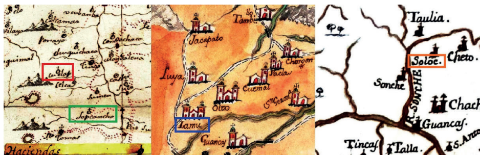
Figura 6. Izquierda: mapa del 1847 que registra Lopcancha, sin la <e> intermedia de apoyo (Arriaga 1847). El mismo mapa contiene Cuelap, cuyo nombre se refiere no al sitio arqueológico sino a la hacienda, según el símbolo usado; centro: mapa del 1788 que consigna Lamu sin la <d> final (Anónimo 1788); derecha: mapa de 1789 aprox. que registra Soloc sin la <o> final (Martínez Compañón 2015 [1789], 118r).