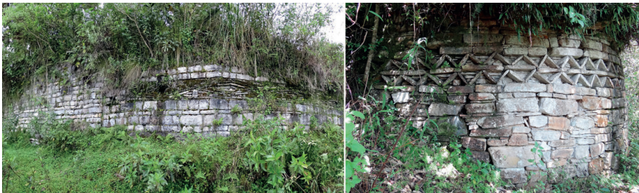
Figura 7. Izquierda: complejo arqueológico de Yálape; derecha: complejo arqueológico de Óllape.

Tanto en algunos medios de comunicación como en las publicaciones del Gobierno Regional de Amazonas (p. ej. Nureña 2010, 37), se indica que “en lengua nativa, Kuélap significa ‘lugar frío’, y es que, a pesar de encontrarse en la selva peruana, tiene un clima templado”. Esta explicación no solo carece de fuente científica, sino también se basa en datos climáticos equivocados, ya que ni Kuélap (ubicado a 3000 m.s.n.m.) ni la mayor parte del área Chachapoyas se encuentran en la selva baja, sino más bien encima de los 2000 metros de altura.