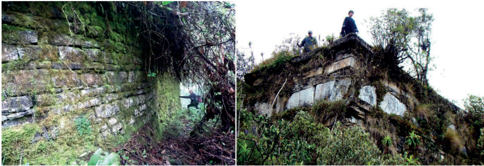
Figura 5. Izquierda: sitio arqueológico de Pirquilla; derecha: sitio arqueológico de Pirka-Pirka (fotos: izquierda: Stefan Ziemendorff, 2015; derecha: Stefan Ziemendorff, 2010).

A esto se suma la observación de D’Altroy de que los agricultores andinos con frecuencia utilizan la palabra marca como término genérico para designar una ciudad arqueológica (citado en Bradley 2005, 89). El caso de los términos ‘muro’ o ‘muralla’ mencionados por Raimondi y Bandelier es prácticamente idéntico, ya que de igual manera el término quechua pirka ‘muro’ se suele aplicar a ruinas, también en el área Chachapoyas, donde encontramos, entre otros, Las Pircas (San Francisco de Daguas, Chachapoyas), Pirquilla cerca de Congón (Ocúmal, Luya) y Pirka-Pirka cerca de Llamac-tambo (Uchumarca, Bolívar, La Libertad). Los últimos dos se muestran en la Figura 5.