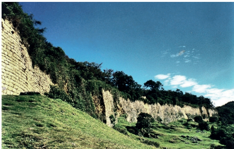
Figura 1. Muralla exterior del complejo arqueológico de Kuélap.

cuestión, revisando su atribución al idioma chacha y analizando los componentes kue y lap de manera separada. Finalmente, ofrecemos, a modo de conclusión, los resultados más importantes de este estudio.