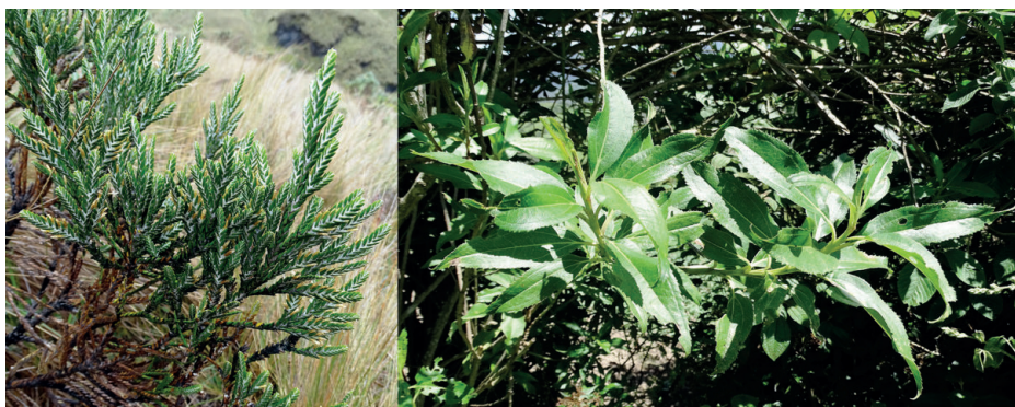
Figura 9. Plantas denominadas “laplap”, izquierda: Loricaria sp. cerca del cerro Shubet; derecha: Hedyosmums sp. cerca de Kuélap.

Cabe mencionar que, al igual que en el caso de la raíz [kwe], lap aparece en la fitonimia local, en el nombre vernacular laplap , una planta del género Loricaria (Weberbauer 1920, 8-9). Esta crece por encima de los 3000 hasta 4500 m s. n. m. (Bussmann y Sharon 2016, 103), por lo que no la hemos hallado en ninguno de los sitios visitados, sino a 13 kilómetros de Kuélap cerca del cerro Shubet a 3550 m s. n. m. (ver Figura 9).