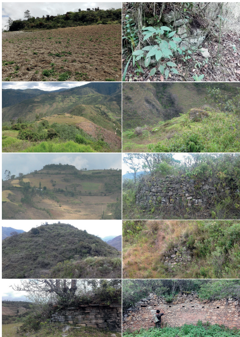
Figura 8. 1. a fila, izquierda: Tierras de cultivo en Conila, derecha: Resto arqueológico en Conila; 2. a fila, izquierda: Pirka Loma (Tínlape), derecha: Resto arqueológico en Pirka Loma (Tínlape); 3. a fila, izquierda: Tálape visto desde Colcamar, derecha: Edificio circular central de Tálape; 4. a fila izquierda: Órlape visto desde la carretera, derecha: Restos de una pared en Órlape; 5. a fila, izquierda: Chukllas en Tólape, derecha: Puka Pirka en Cúlape.