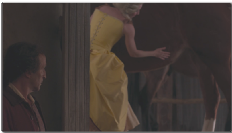
Figura 3. Frustración y desencuadre [00:19:28]

La expresión del deseo de Zama pasa casi exclusivamente por la mirada, en sus encuentros con las distintas mujeres por las que se siente atraído en la primera parte de la película. Como con su andar errático por la orilla del río, la interpretación de Giménez Cacho otorga un carácter enfebrecido a la mirada, oscilando permanentemente entre la fijación y la elusión de su objeto, entre la voluntad de intervenir en la realidad y la inmediata renuncia a ello. Solo con Rita, la hija de su primer huésped, intentará un contacto físico, mientras que con Luciana se atreverá a balbucear algunas palabras que expresen su deseo. En ambos casos, las respuestas a sus insinuaciones supondrán un jarro de agua fría.