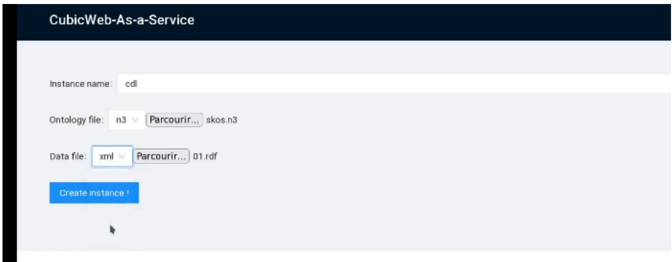
FIGURE 1 – Interface d'accueil de CWaaS