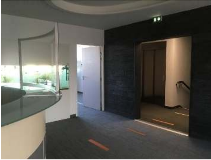
Figure 23 : Mise en image d'un accueil standard