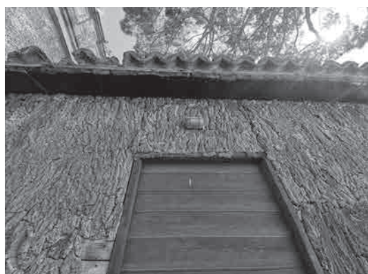
Figure 5: Restes de liège sur l'encadrement d'une porte