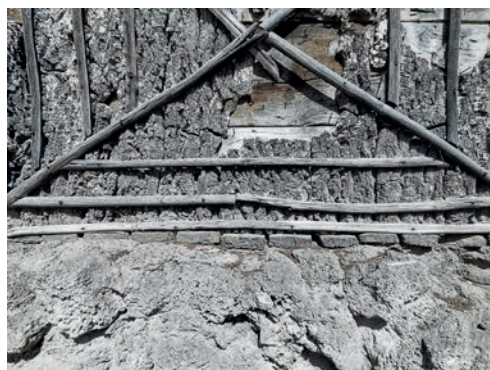
Figure 4: Le socle en pierre surmonté d'une rangé de briques