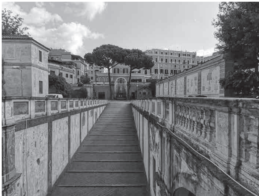
Figure 1 : L'escalier qui monte du palais Barberini vers le jardin. À droite la Casina et le mur arrière de la serre, au fond la statue d'Apollon et la palazzina Savorgnan di Brazzà

la Biblioteca pontificia, dont les archives n'éclairent l'histoire du palais Barberini que jusqu'au XVIII e siècle.