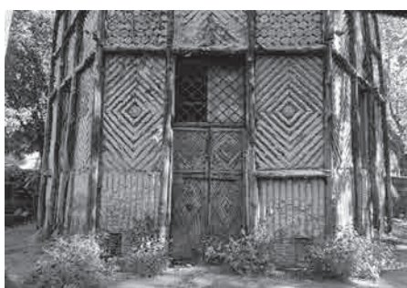
Figure 8: Détails de l'habillage de la maçonnerie

Cette idée du chalet suisse, qui semble aujourd'hui saugrenue dans un tel environnement 8 , ne doit pas être attribuée aux seules racines familiales de l'architecte: en réalité, toute l'Europe succombe à cette époque à cette mode. Depuis la fin du XVIII e siècle, les naturalistes explorent les Alpes, les géographes les cartographient, les artistes racontent leurs ascensions, des voyageurs instruits y