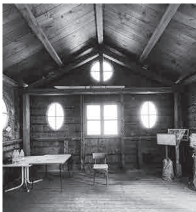
Figure 3: Élévation intérieure de la façade principale.