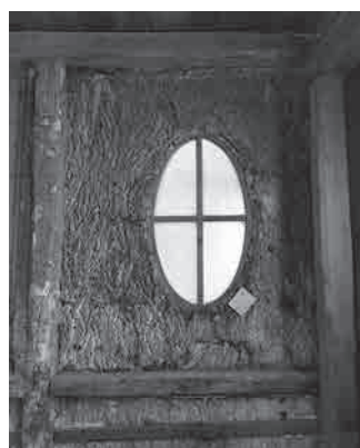
Figure 6: Détail du revêtement intérieur