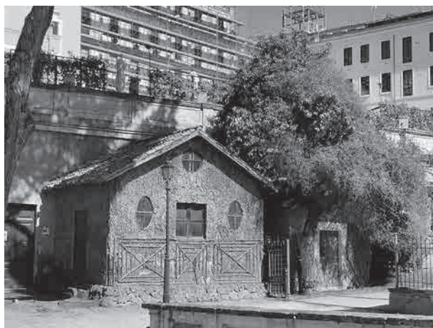
Figure 2: La Casina di sughero

À Rome, une maîtrise insoupçonnée de la construction en bois se retrouve aussi dans le socle surélevé en pierre rustique et dans les détails qui permettent de gérer l'eau. Les portes d'origine, à en juger par les traces de liège présentes sur les encadrements, devaient également être revêtues en liège. Le parement de façade assure la bonne conservation du support de bois. Des losanges décoratifs en listels de bois viennent se superposer à cette peau en partie basse. La façade n'a pas forcément été entretenue, alors que le revêtement de toit et les menuiseries semblent avoir été remplacés, mais pas nécessairement à l'identique.