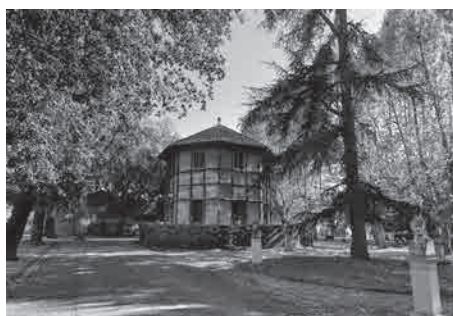
Figure 7: La promenade patriotique sur le Pincio, avec le pavillon

Sa fonction ici est, en revanche, bien déterminée: il s'agit d'un réservoir d'eau. L'architecte communal, Gioacchino Ersoch (1815-1902), avait été chargé d'intégrer cet aménagement fonctionnel dans la nouvelle promenade publique, qui devait être digne du nouveau statut de la ville, celui de la capitale du nouvel État italien (1870). Chargé de l'aménagement des espaces verts, Ersoch proposa un habillage en chalet suisse, et le chantier se déroula entre 1872 et 1874 (Impiglia, 2013). Ersoch effectuera sa carrière durant plus d'un demi-siècle à la mairie de Rome, où il deviendra architecte en chef 6 . Sa famille, originaire du canton suisse d'Argovie, vit à Rome depuis le XVIII e siècle. Figure longtemps négligée, une exposition lui a été consacrée en 2015 7 .