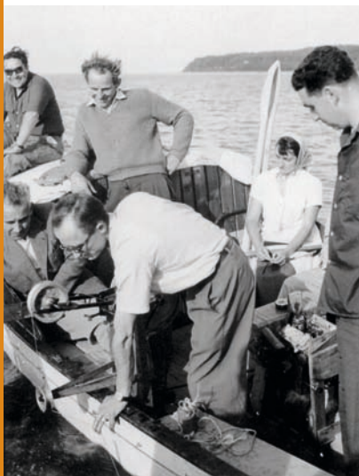
Les méthodes de sondage utilisées vers 1960.