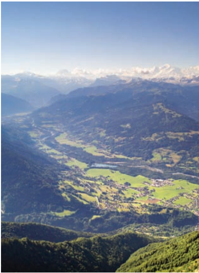
Une publication du Centre de la Nature Montagnarde