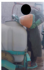
Figure 3 – Incorporation de produits

écueils de conception qui se traduisent au regard de l'emplacement des organes (commandes, radio, filtres, etc.), de leurs accès (réservoir d'essence, cuve, etc.) et de leur conception (cuve, buses, etc.) durant les trois phases d'activité analysées. Ces problèmes de conception sont source de risques d'exposition aux pesticides dans une majeure partie des cas. En effet, 70% des difficultés d'usage identifiées présentent des risques d'exposition directe et indirecte aux pesticides. Pour exemple,