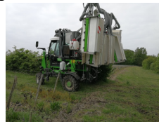
Figure 1 - Pulvérisateur porté de l'exploitation 1

Le travail de recherche a été mené au sein de deux exploitations viticoles que nous appellerons respectivement exploitation 1 et exploitation 2. Il a été choisi de sélectionner des exploitations avec des caractéristiques différentes (particularité, mode de culture, type de pulvérisateur) pour ainsi observer des utilisations non similaires des pulvérisateurs. L'exploitation 1 possède un pulvérisateur porté neuf et haut de gamme avec des panneaux récupérateurs en confiné ( cf. Figure 1) tandis que celui de l'exploitation 2 est un pulvérisateur traîné plus ancien et moins évolué ( cf. Figure 2).