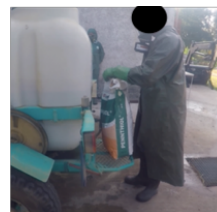
Figure 5 - Catachrèse du marchepied

Des processus de genèse instrumentale ont été identifiés à l'utilisation du pulvérisateur au sein des deux exploitations. Pour l'exploitation 1, nous observons principalement le processus d'instrumentation, qui correspond à l'émergence et à l'évolution des schèmes, ce qui s'explique par l'introduction récente du pulvérisateur au sein de l'exploitation. Nous pouvons illustrer ce propos par les schèmes qu'ont dû développer les opérateurs en ce qui concerne l'utilisation du tableau de commandes au sein de la cabine : « C'est compliqué, il faut se mettre la gymnastique d'utilisation, c'est complexe [...] c'est pas aussi simple qu'une appli de smartphone ». Pour l'exploitation 2, on observe à la fois les processus d'instrumentation et d'instrumentalisation. Ce dernier est mis en visibilité par les modifications matérielles qu'a apportées le viticulteur à son pulvérisateur (support de commandes en cabine). De nouvelles fonctions peuvent aussi être conférées au pulvérisateur sans modifications matérielles. C'est l'exemple