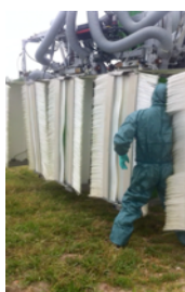
Figure 4 – Buse bouchée

au sein de l'exploitation 2, la hauteur de la cuve n'est pas adaptée à la tâche que l'opérateur doit réaliser, à savoir déverser des sacs de produits pouvant peser jusqu'à 25 kg. Cette opération demande à l'opérateur de prendre appui sur la surface de la cuve ce qui entraîne des risques d'exposition indirecte aux pesticides d'autant plus que son tablier est ouvert amenant à un contact direct entre la cuve et les vêtements de l'opérateur (cf. Figure 3). Les défauts de conception constatés et les risques associés concernent autant du matériel neuf et haut de gamme que du matériel ancien. En effet, la comparaison des deux pulvérisateurs montre plus de facilités d'usage pour le pulvérisateur ancien où la technologie intégrée est pourtant moindre. Les variabilités rencontrées à l'utilisation des pulvérisateurs sont aussi source de risques d'exposition aux pesticides telles que les buses et les filtres bouchés qui demandent à l'opérateur de descendre de sa cabine en plein traitement (cf. Figure 4). Cette première partie de résultats permet