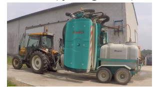
Figure 2 - Pulvérisateur traîné de l'exploitation 2

La première phase exploratoire a permis de préciser les phases d'activité sur lesquelles devaient s'orienter les analyses : la préparation de la bouillie, l'application de la bouillie et le nettoyage du pulvérisateur. De manière entrecroisée, il a été réalisé : des entretiens individuels, des observations filmées, des mesures et des entretiens d'autoconfrontation. Ces trois méthodes ont donné lieu à des analyses qualitatives regroupant les observables et thèmes suivant : achat du pulvérisateur, difficultés et/ou facilités d'usage, variabilités, aléas et incidents rencontrés, modifications apportées au pulvérisateur, risques d'exposition directe et/ou indirecte aux pesticides.