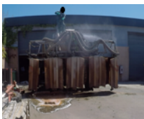
Figure 7 - Nettoyage du pulvérisateur

Pour illustrer ce propos, nous pouvons prendre pour exemple le nettoyage de la cuve considéré comme indispensable à chaque fin de traitement. La conception et