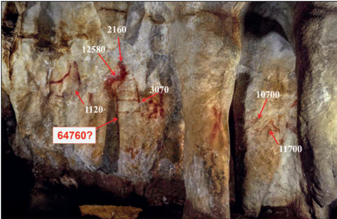
Figura 2.: La Pasiiega, galería C (Cantabria). Representaciones figurativas y no figurativas cubiertas por finas concreciones calcíticas que han sido datadas por U/Th. Todas las fechas están entre 2.160 y 12.580, excepto una que ha aportado una edad mínima de 64.760 años.

several highly localized factors» (Aubert et al. , 2018), pero el hecho de que un razonamiento tan cargado de consecuencias arqueológicas se apoye sobre una única fecha, que además es 30.000 años más antigua que todas las demás, convierte en discutible el resultado y debería incitar a la mayor prudencia.