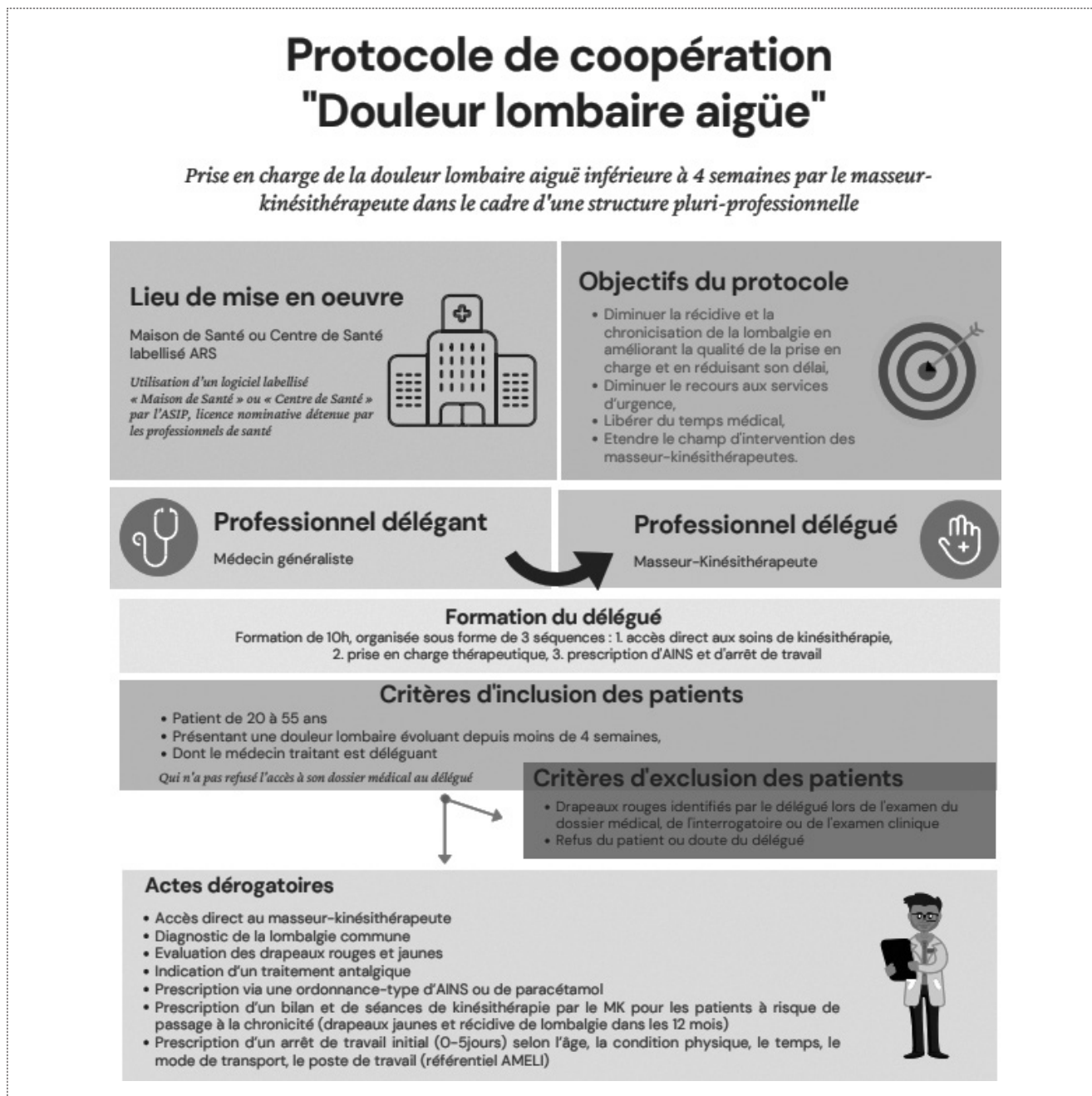
Figure 2: Illustration du Protocole de coopération national pour la douleur lombaire aiguë.

de coopération pour la lombalgie aiguë est présenté dans la figure 2.