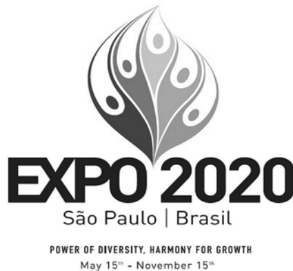
Figure 3. Logo et devise de la manifestation São Paulo 2020, avec l'aimable autorisation du BIE et de SPE, 2012.