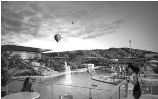
Figure 6. Méga-événement et utopie urbaine, São Paulo Expo©, avec l'aimable autorisation du BIE et de SPE.