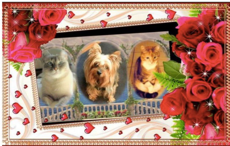
Image 3 : Capture d'écran d'un montage photographique sur Yummypets publié le 25 mai 2021

L'énonciation collaborative en ligne est aussi une forme d'écriture inédite employée sur Yummypets . Ce processus de construction collaborative du discours est à mi-chemin entre une discussion orale et un jeu littéraire écrit. Les utilisateurs s'imaginent des scénarios fantaisistes dont leurs animaux seraient les acteurs principaux : rentrées des classes, goûters d'anniversaires et même mariages sont organisés entre membres de la communauté. Ils réalisent ces scénarios sous forme de jeux de rôles. Les différents utilisateurs publient, se répondent en commentaires et réalisent des montages photos, tel un cadavre exquis numérique. Ces pratiques amateurs communautaires font partie des rituels des utilisateurs "fictifs" (pour reprendre la nomenclature des profils dressés ci-dessus).