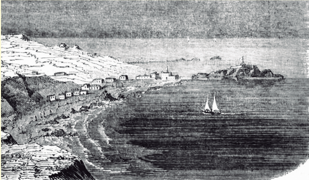
Figura 3. Ilustración del puerto de Cobija.

Se dice que esta[ba] bien montada, equipada y disciplinada” ( El Clamor Público , 24 de agosto del 1853, p. 2).