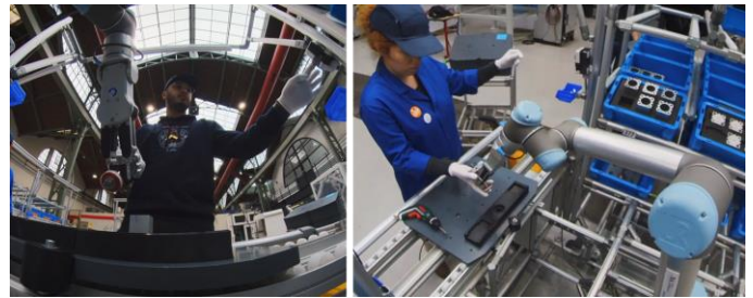
Figure 3 : Poste applicatif envisagé montrant une interaction entre Humain et cobot manipulateur (LISPEN/ENSAM Lille).

La méthode sera déployée au LISPEN (Arts et Métiers Lille) sur un pas de ligne cobotisé (robot collaboratif de type UR5) avec deux objectifs principaux. Le premier objectif est de réaliser une analyse comparative de l'influence de différents niveaux d'exploitations du savoir-faire humain sur les indicateurs de performances (en phase de formation et d'exploitation) pour un cas de désassemblage de vérins pneumatiques. La Figure 3 illustre une application dans le cas de l'assemblage de vérin en mode collaboratif de type surveillance des efforts.