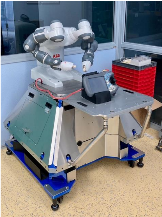
Figure 4. Le robot YUMI utilisé (LAMIH/INSA Hauts-de-France)