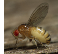
▲ Le bon développement de leurs ovocytes est également assuré par une action du cytosquelette.

Nos travaux sur les ovocytes de souris dévoilent que la bonne maturation de cette cellule passe par une action mécanique, exercée par le cytosquelette sur le noyau cellulaire. Celle-ci remodèle la forme des gouttelettes à l'intérieur du noyau qui contiennent des ARN messagers. Ce mécanisme est-il présent chez d'autres espèces que les mammifères ? En collaboration avec l'équipe de Jean-René Huynh, au