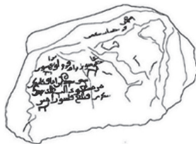
Рис 1. Караханидская посетительская наскальная надпись. Тосор. Иссык-Кульская область (Фото из книги Табалиева и Белека, прорисовка К. Белек)