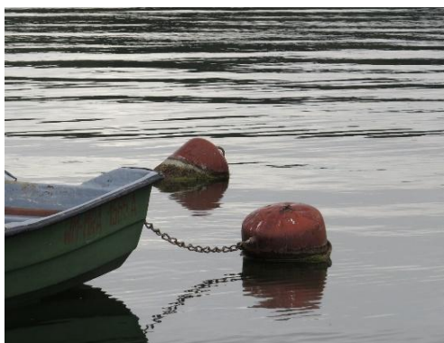
Figure 1. Bateau et deux bouées