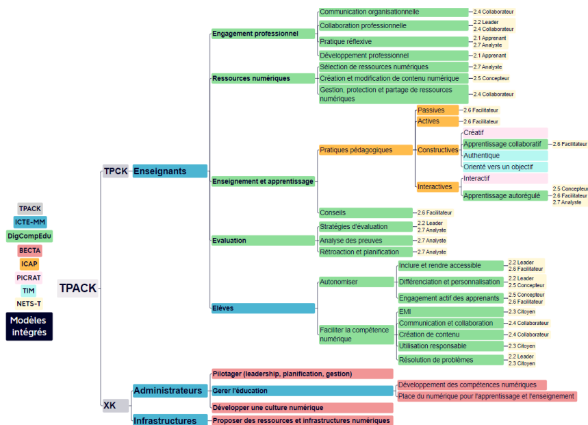
Fig. 1. (a) Modèles considérés (b) Critères de caractérisation des modèles de maturité

Le modèle unifié proposé comporte 3 domaines principaux (issus de l'ICTE-MM) : enseignants, administrateurs et infrastructure. Le domaine enseignant a été réduit à 4 sous-domaines (provenant du DigCompEdu) : engagement professionnel, ressources numériques, enseignement et apprentissage, évaluation et élèves. Les sous-domaines « enseignement et apprentissage » et « évaluation » pourraient être fusionnés, comme dans le CRCN-Edu, mais la spécificité des sous-domaines de « évaluation » qui correspond à un rôle d'analyste doit être distinguée.