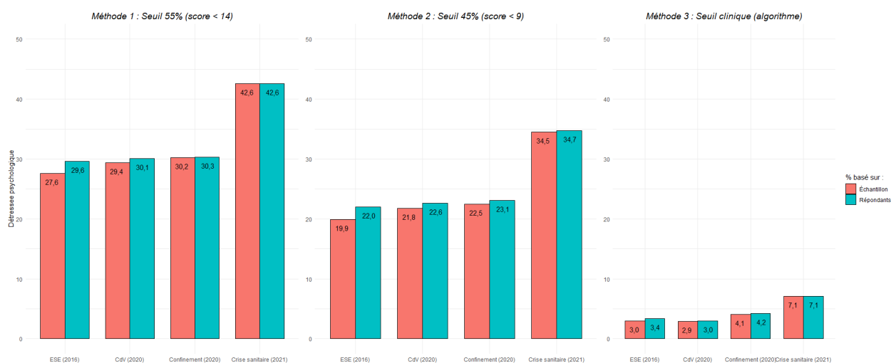
Figure 3.4: Comparaison de l'évolution de la détresse psychologique en fonction des enquêtes. Lecture : Chaque barres indique le pourcentage d'étudiant en détresse psychologique, avec

Pour les items « nervosité », « tristesse » et « calme et détendu » (dans sa modalité de réponse négative : « non calme et détendu »), on ne constate que peu de différence entre les trois premières études, cependant en 2021 (Crise Sanitaire), tous les taux ont augmenté en moyenne de 10 points. Pour l’item « découragement », alors que les résultats de la première et troisième étude sont similaires, on constate que le taux de la seconde étude est supérieur aux deux autres d’environ 5 points, et que la dernière étude est elle-même supérieure à la seconde de 5 points également. Enfin, pour l’item « heureux » (dans sa modalité de réponse négative : « non heureux »), les études de 2016 et de confinement 2020 ont des résultats similaires, alors que les études condition de vie 2020 et crise sanitaire sont supérieures d’environ 10 points aux deux autres (figures 3.2).