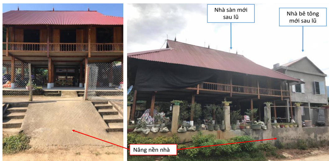
Hình 1: Nâng cấp nhà sau lũ

trôi mỗi hộ được nhận 20 triệu đồng (12 hộ). Kinh phí này do Mặt trận Tổ quốc tỉnh cấp và chỉ những người có chứng nhận quyền sử dụng đất và hộ khẩu cư trú mới đủ điều kiện được hưởng trợ cấp đền bù. Chúng tôi đã gặp những hộ dân bị ảnh hưởng nặng nhưng không có giấy chứng nhận quyền sử dụng đất hoặc hộ khẩu. Kết quả là họ không được hưởng lợi từ sự hỗ trợ này của Nhà nước và vẫn duy trì tình trạng dễ bị tổn thương. Ngoài ra, Hội Chữ thập đỏ đã phân phát từ 2 đến 7 triệu đồng cho tất cả các hộ gia đình bị ảnh hưởng ngay sau thiên tai và vào dịp Tết Nguyên Đán sau đó.