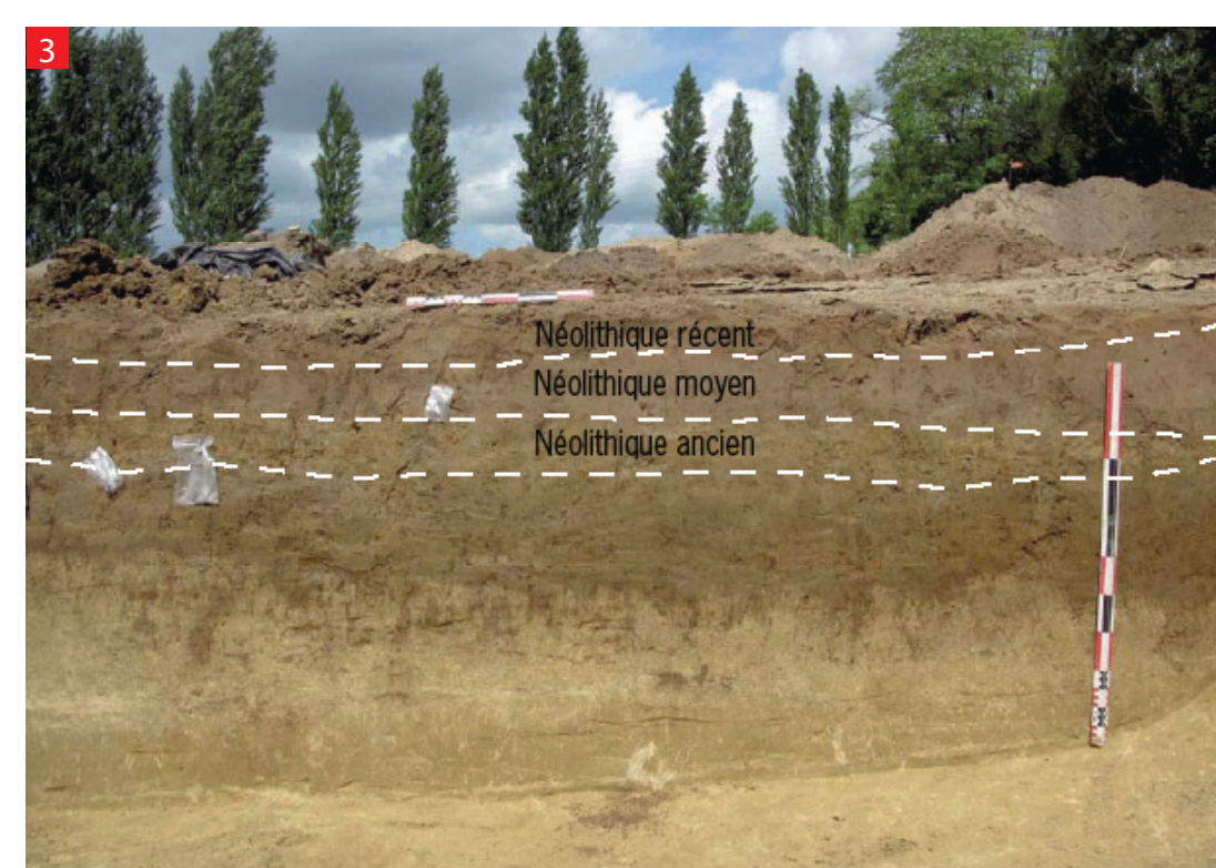
7 Coupe stratigraphique de la dépression 3 (sud-est)