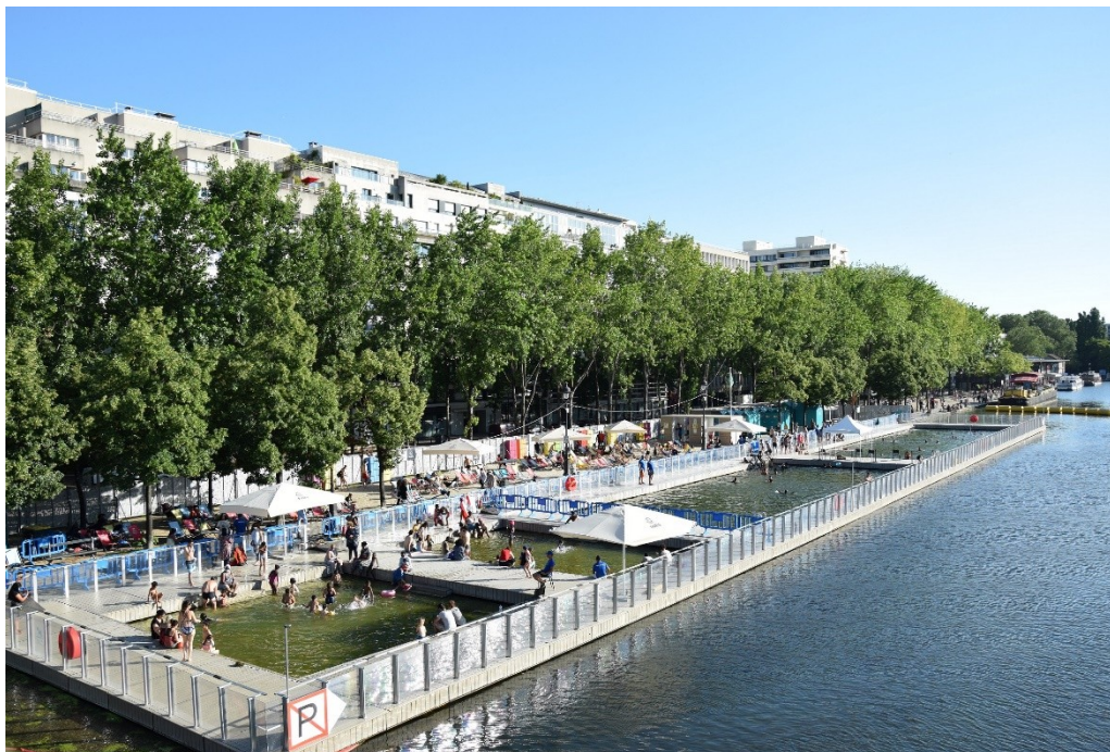
Figure 2. La baignade du bassin de la Villette en fin d'après-midi, 18 juillet 2021

séparés du reste du cours d'eau, l'entrée limitée à 500 personnes maximum, et une surveillance multiple est assurée par des services de sécurité privés et des MNS employés par la Mairie de Paris. Les coûts de fonctionnement sont élevés et la capacité d'accueil est vite insuffisante les jours de grande chaleur ou en fin de semaine.