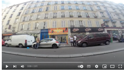
SoundWalking: Streetwalk (2014). https://www.youtube.com/watch?v=QQcfEi3oO3A