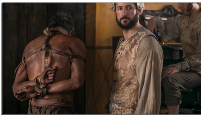
Figura 3: El reo indígena

precia de ser un descendiente de Irala, y sin respetar el protocolo que exigía la redacción de un expediente y la espera de la decisión real que podía tardar años en llegar. Zama parece tratar al jefe de familia como a él le gustaría que lo trataran, recompensando los “buenos servicios” rendidos de los “vecinos” que seguían convencidos de sus derechos sobre los indios a pesar de las Nuevas Leyes y demás reformas iniciadas desde hace harto tiempo. De hecho, es una de las pocas oportunidades que tiene Zama de hacer alarde del poder que le confiere su cargo menguado por la presencia autoritaria del gobernador de turno y el control que ejerce su asistente español omnipresente. A escondidas de éste, Zama accede a favorecer el comercio del “Oriental”, y también le concede a Luciana la autorización que ella le pidió para que su esclava, ahora libre pero muda, Malemba, pueda casarse. En resumidas cuentas, se ofrece un retrato del pragmatismo y del oportunismo de todos los representantes de la Corona, cuya corrupción remite a un sistema de dominación y de privilegios que imperaba en las lejanas tierras de ultramar donde la ausencia de minas restringía las posibilidades de enriquecerse. Lejos de El Dorado, y sin recibir el pago que les correspondía, los funcionarios del Rey cumplían sus tareas de justicia, administración y recaudación de tributos fuera del control y en un clima de tensiones con los peninsulares.