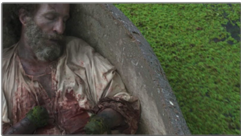
Figura 8: Fotograma de Zama [01:47:33]