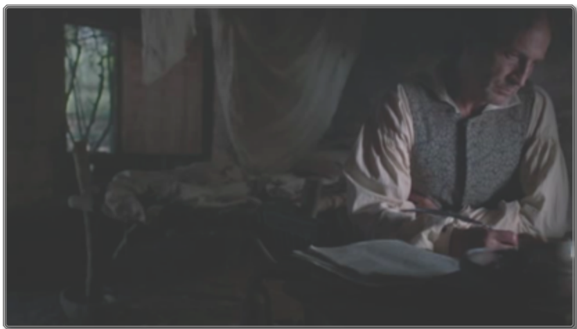
Figura 3 : [01:07:07]

Este plano parece referirse al famoso Capricho número 43, “El sueño de la razón produce monstruos” (1797-1799, aguafuerte, aguatinta sobre papel verjurado, 20,1 x 30,6 cm, Madrid, Museo del Prado) 19 . Podría remitir, más rigurosamente, al instante que precedería la representación de Goya, es decir el momento en que el personaje todavía estaría escribiendo, como la inclusión del detalle de la pluma, en el grabado, lo sugiere 20 . Por lo demás, la sombra que atraviesa fugazmente el campo, durante este plano, parece anunciar la entrada del protagonista en un mundo onírico alucinatorio, efectivamente materializado por la voráGINE de murciélagos y búhos presente en la célebre composición goyesca.