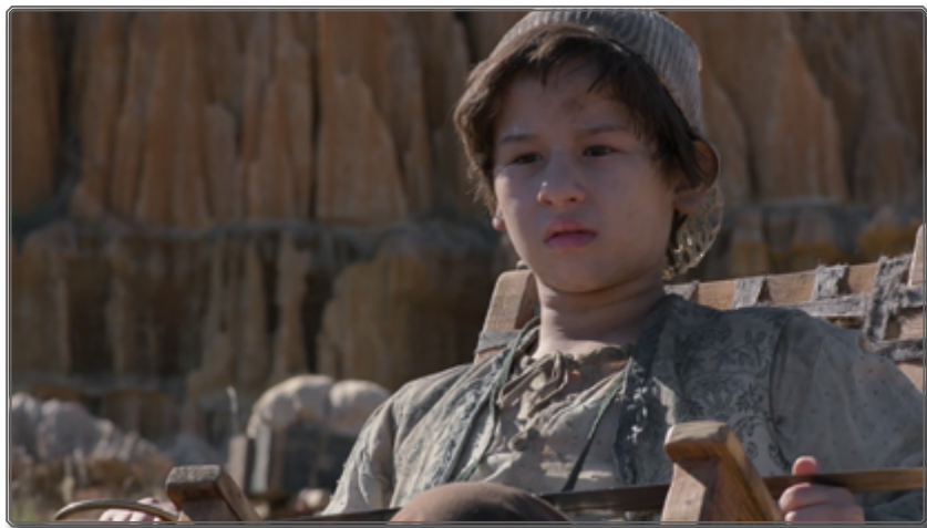
Figura 4: El hijo del Oriental [00:11:26]

hijo de este entra en el encuadre por la derecha, en una silla llevada por un porteador, y desenfocado por la poca profundidad de campo. La secuencia está mayoritariamente construida a partir de un primerísimo plano del rostro de Zama, dejando a los interlocutores fuera de campo, procedimiento que aísla al personaje no sólo de los demás personajes, sino de la propia realidad, a lo que contribuye también el uso del desenfoco.