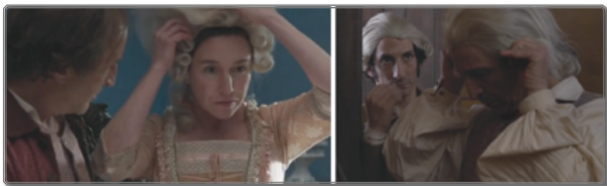
Figura 5 [00:28:33; 00:30:21]

Lo anterior se confirma cuando antes de iniciar un proceso, Ventura Prieto entra en la oficina poniéndose la peluca y acomodándose insistentemente el accesorio. Zama por su parte se coloca, a su vez, la peluca y le pregunta “¿Qué espectáculo es este?”, haciendo alusión al caso que debe tratar. Dicha oración, pronunciada por el personaje principal, le permite a Martel reforzar la idea de un sistema colonial basado en las apariencias y en la falsedad. La peluca asociada a la palabra “espectáculo” remite nuevamente a la idea teatral (esta vez asociada al caso que debe atender), como si de antemano supiera que el juicio es una farsa.