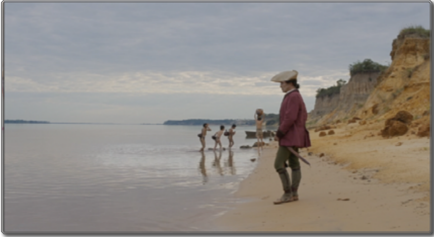
Figura 2: Zama , [00:01:00]

Conocida como “la perla del Paraná”, la localidad descrita por Selva Almada 16 es la que proporcionó una localización decisiva para el rodaje: la de sus barrancas al río Paraná, que puntúan las tres partes de la película.