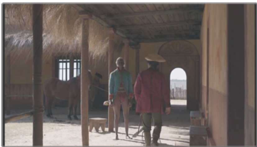
Figura 6: Fotograma de Zama [00:45:06]

Varios objetos convencionales se desvían del uso consagrado para revelar al espectador la fragilidad de estos títeres. Las pelucas, tan típicas en las películas históricas, nunca están bien colocadas, nunca las llevan con la debida elegancia. No sólo sirven para marcar una postura jerárquica ya que, como lo vemos en el siguiente fotograma, el misterioso paje de librea, pero sin pantalones y descalzo, también dispone de este objeto habitualmente reservado a los de rango más elevado.