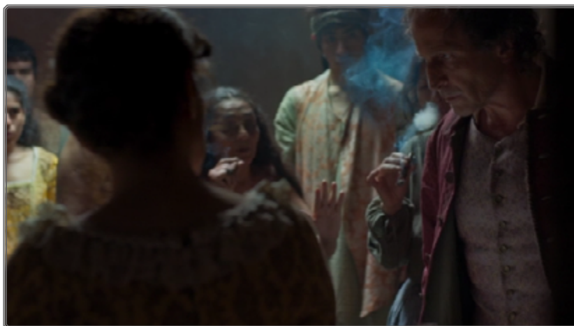
Figura 5: espacios fuera de tiempo, el ritual indígena

- en la segunda parte del relato, la subtrama más importante es la que gira en torno al libro de Fernández que precipita la marginación de Zama, y en torno al que va a volver a cristalizar su impotencia, ya que Zama se revela incapaz de resistir la orden de redactar un informe “implacable” en contra de su propia voluntad, porque el Gobernador le anuncia que “no habrá carta si no hay informe”.