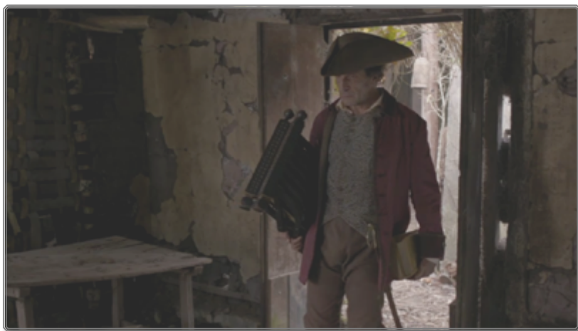
Figura 2: Fotograma de Zama [01:04:05 27 ]

© Rei Cine SRL, Bananeira Filmes Ltda, El Deseo DA SLU, Patagonik Film Group SA 28