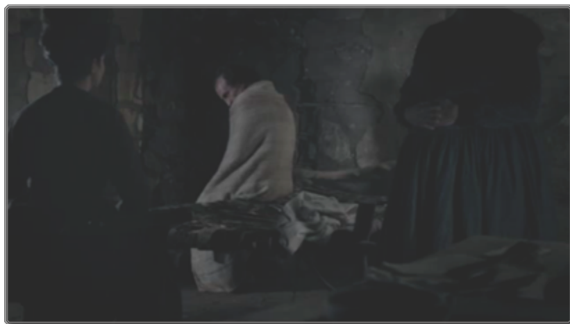
Figura 4 [01:13:27]

El plano muestra a Zama arropado en una manta, al borde de su cama, atemorizado por dos extraños personajes femeninos, uno de espaldas en la izquierda, otro extrañamente decapitado en la derecha. Tanto la composición muy contrastada de la escena como la postura encogida del protagonista podrían de nuevo evocar los Caprichos al ser dos rasgos recurrentes en la serie concebida por Goya. Los grabados número 34 y 48 de la serie, por ejemplo, “Las rinde el sueño” y “Soplones” 21 , se construyen a partir de la masa clara de frailes acurrucados que, como Zama aquí, parecen ser víctimas de una situación que escapa a su comprensión.