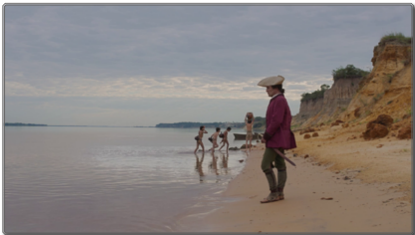
Figura 1: La mirada colonial [00:01:15] 3

En las dos secuencias iniciales, el personaje de Zama se construye a través de dos miradas que lo van a caracterizar a lo largo de la película. En la primera, el antiguo corregidor, degradado a asesor letrado, otea el fuera de campo, escudriñando el horizonte situado al otro lado del río, dirigiendo su mirada hacia un lugar invisible –por inalcanzable– para él mismo y para el espectador. Su actitud altiva, resaltada por los atributos del uniforme, asiendo la empuñadura de la espada, lo identifica como un representante de una autoridad colonial cuyo centro de decisión, radicado ultramar, está marcado por la ausencia, condenando al personaje a “la espera”, para retomar el concepto enunciado por Antonio Di Benedetto para caracterizar a la novela que sirve de fuente al film. Espera de una manifestación de la autoridad real, pero también espera de que su súplica para un traslado sea aprobada 4 . La rigidez altanera del representante de la Corona entra sin embargo en contradicción con otra actitud gestual, por la cual su cuerpo se ve sometido por conatos de movimientos incongruentes: desde murmullos y muecas apenas esbozados hasta un caminar errático. El cuerpo de Zama parece sacudido por dos corrientes adversas, oscilando entre la llamada de ultramar y la proximidad de los niños indígenas aguadores que hacen su aparición desde el fuera de campo,