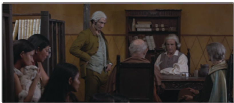
Figuras 4: Concesión de la encomienda de indios

La cuarta cita ( María Elena , 00:30:38-00:32:12), interviene durante la secuencia de la concesión de una encomienda de indios por Zama a una pareja de criollos, pobladores de Concepción que pretenden ser descendientes de Domingo Martínez de Irala, primer Gobernador de Paraguay. La concesión de encomienda habiendo sido prohibida por la Corona española, se trata aquí de un abuso de poder de Zama, para complacer a la pareja de ancianos, criollos, que reivindican su derecho de pedir mano de obra gratuita para sus tierras aduciendo la participación de sus antepasados ilustres en la conquista. Paralelamente, el montaje en plano contraplano —una figura de montaje poco frecuente en la película— introduce en la secuencia una segunda trama que revela el deseo de Zama por la nieta mestiza de la pareja de ancianos. La música de la famosísima canción de amor romántico María Elena parece aquí subrayar, por una parte, el abuso de poder de Zama, asociado con la pareja de ancianos desaliñados, oponiéndolo a la hermosura, dignidad y nobleza de la nieta mestiza y de las indígenas que la rodean. No es casual que la ocurrencia empiece en un plano de conjunto en el que Ventura Prieto presenta a Zama y se presenta a sí mismo como representante del poder y del decoro de la Corona. Al final de la visita, el beso de despedida de Zama, rechazado por la joven, constituye un eco visual al sarcasmo musical.