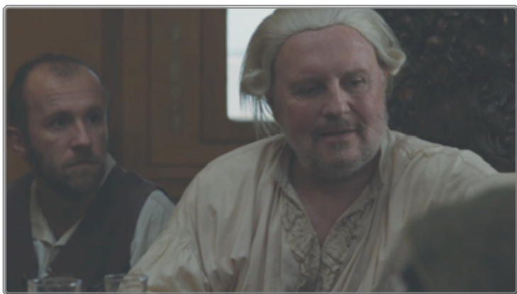
Figura 6: Bufón velazqueño y orejas de Vicuña Porto

La quinta ocurrencia ( Siempre en mi corazón , 00:51:00-00:52:01) apunta el carácter grotesco de la reunión de juego en la residencia del segundo gobernador. Asociada con una representación de un poder inicuo, la representación de la figura de un personaje deforme acompañando al gobernador puede evocar un bufón velazqueño. La compañía, que rodea al gobernador, desaliñado y con peluca mal encajada, utiliza como apuesta para el juego las supuestas orejas del bandolero mítico Vicuña Porto, atadas a una cuerda. El llamado “botín” aparece repugnante, llegando el gobernador a olerlo, el poder siendo representado como indecoroso y arbitrario mediante la figura del gobernador. Esta secuencia marca una etapa en la degradación social y la progresiva humillación de Zama cuya aparición con pescados en la mano puede interpretarse como una etapa de su muerte social, dada su identificación con los peces al principio de la película. La secuencia es también el último coletazo del pez-Zama que puede esperar que la carta de petición de su traslado se va a escribir por fin, una esperanza de nuevo frustrada en la secuencia posterior.