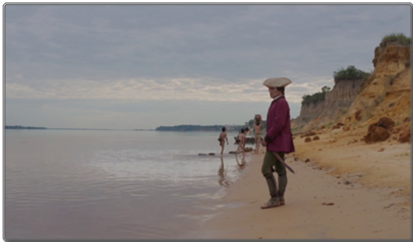
Figura 7: Fotograma de Zama [00:01:40]

modificaría a estos personajes y sus trajes durante el desarrollo de la historia 42 . A medida que el personaje decae económica y físicamente, su ropa se rasga, se ensucia por contacto con la realidad circundante. Al contrario del personaje, el entorno natural vegetal afirma su magnificencia, además de facilitar lo que Julie Amiot-Guillouet llama en su artículo un “imaginario ahistórico” 43 . Se descontextualiza el final para alcanzar una poetización y una universalización del mensaje.