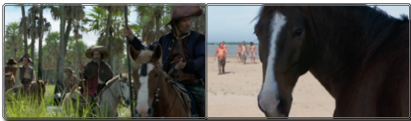
Figura 7: [01:19:57]

Por lo menos es la sensación que tenemos al asistir al grotesco desfile de Quijotes que inaugura la vana persecución de Vicuña Porto (fig. 7) o al enfrentarnos a la extraña mirada a cámara del caballo que precede el estallido de violencia final (fig. 8). En ambos casos no podemos identificar un único referente icónico, el plano fijo no es la exacta transposición de una imagen preexistente. Y sin embargo, los soldados a caballo con sus lanzas inútiles “tienen algo” de las representaciones quijotescas, al igual que “hay cierto parecido” entre la inquietante presencia del caballo silencioso delante de Zama y el animal endemoniado del famoso grabado de Hans Baldung Grien, El palafrenero embrujado (ca. 1534, grabado sobre madera, París, Bnf) 24 . ¿Azares del rodaje o referencias satíricas cuidadosamente difuminadas? La pregunta no admite una respuesta inequívoca pero invita a ver con otros ojos el Zama de Lucrecia Martel.