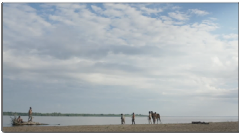
Figura 5: Zama , [1:39:28]

Tal como se observa en Años Luz , el documental de Manuel Abramovich (2017) sobre el rodaje de Zama , el trabajo de falseamiento y de reescritura también fue particularmente cuidado y complejo con la entonación y la combinación de acentos: