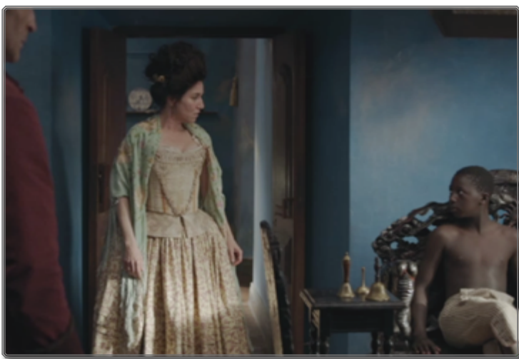
Figura 4: Luciana y un esclavo

Esa tarea de pensar los siglos pasados, que siguen dialogando con nuestras circunstancias históricas actuales es lo que mejor define la renovación de los estudios críticos, las nuevas teorías literarias, y los estudios culturales feministas y decoloniales.