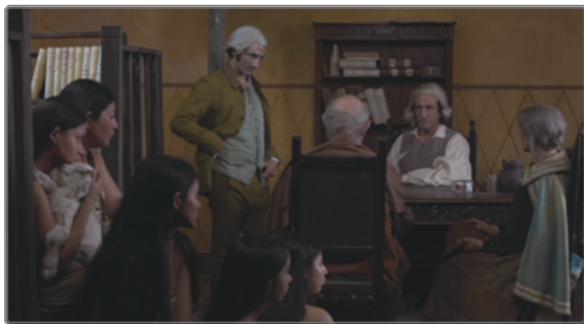
Figura 2: La encomienda

La cámara de Martel observa con curiosidad la decadencia de los cuerpos estancados, torpes y sucios de los colonos que se quejan a todo rato de sus pelucas, del calor, de la humedad, de los bichos, de la comida, la falta de cultura, etc., y que se empeñan en poner en escena y performar “la Civilización”. En el siglo XVIII inventado por Martel, son las costumbres civilizadas del viejo continente, brutalmente importadas a unos territorios cuya geografía, climas y culturas pretenden haber domado, las que resultan exóticas, inadaptadas y ridículas. Resultan grotescos los representantes del microcosmos colonial, en contraste con los cuerpos de las y los nativos, voluntariamente asociados a los animales – como para recalcar la analogía colonial y subrayar su total sinsentido. ¿Al fin y al cabo, quiénes son los civilizados, quiénes son los bárbaros? 5