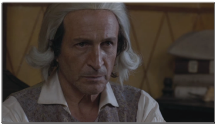
Figura 5: Zama y la llama

El proceso paulatino de agotamiento y desgaste sufrido por Zama podría ser entendido como el debilitamiento y la fiebre de la sociedad hispanocolonial que la llevaron a desintegrarse. Diego de Zama encarna según Ibarren “el fracaso del porvenir”, es decir, “el fracaso del proyecto ilustrado-moderno que los conquistadores habían traído en sus edictos, bulas y fusiles” 17 .