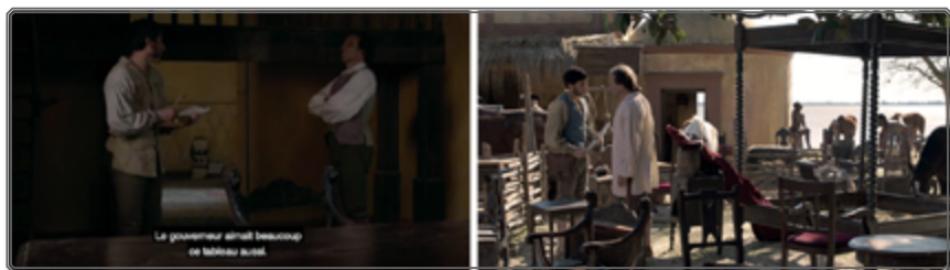
Figura 1 [00:49:28; 00:57:54]

así como en el sentido figurado. Zama constata que el gobernador ha ordenado hacer un inventario de todos los objetos que se encuentran en la Casa de Gobierno y que su cama y sillas personales 25 han sido agregadas en la lista del gobernador. Para tratar de recuperar sus pertenencias, Zama le pregunta a Fernández si no hay manera de sacarlos de la lista. Fernández, quien tiene contacto con los empleados que se ocupan del asunto, le dice que sí, pero que eso tiene un costo [00:57:54].