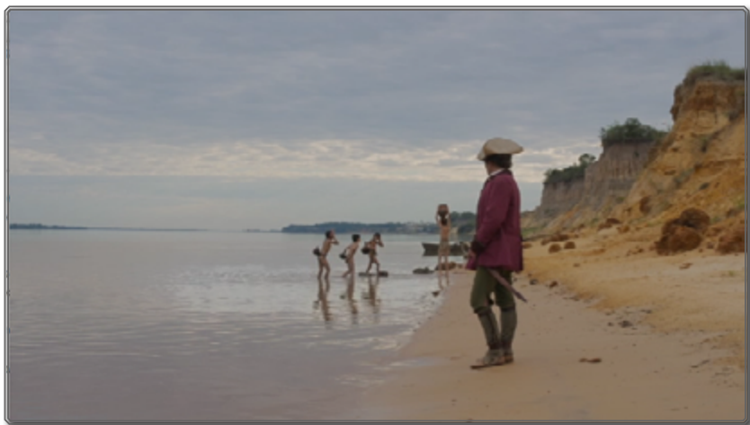
Figura 1: una apertura in medias res que no sitúa.

© Rei Cine SRL, Bananeira Filmes Ltda, El Deseo DA SLU, Patagonik Film Group SA 20