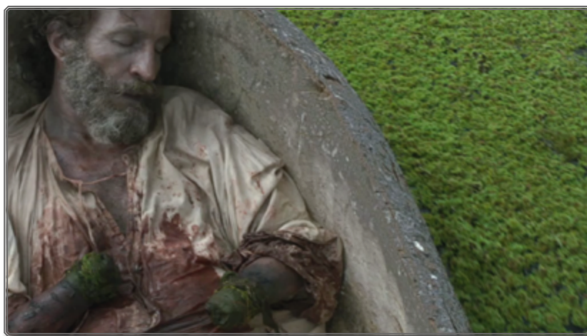
Figura 8: Zama río adentro

se trata del niño rubio que en la novela reaparece y bien podría ser su conciencia al momento de la muerte. Martel eligió salvarle la vida a Zama —por lo menos hasta allí— y darle a un niño indio la última palabra, en forma de pregunta: “¿Quieres vivir?”. La canoa se dirige río arriba, cada vez más lejos de España y más adentro hacia el interior. Zama parece agarrarse por primera vez a la vida. Y esta imagen final invita a varias lecturas, entre otras una metafórica. Al dejar de luchar en “el agua que le rechaza” y al dejarse llevar por otra corriente, Zama acepta la intemperie existencial que representa una identidad equívoca: le cortaron los dos brazos y si no se muere puede que acepte el fracaso. El camino hacia adentro, hacia el norte del río profundo, y no hacia el oeste como al inicio, señala una nueva dirección existencial: Zama hace suya la ambigüedad y deja de esperar. Y esta es también la propuesta que nos hacía la propia Martel mientras terminaba la realización de su cuarta película, en 2016, a unos pocos meses de asumir la presidencia Mauricio Macri.