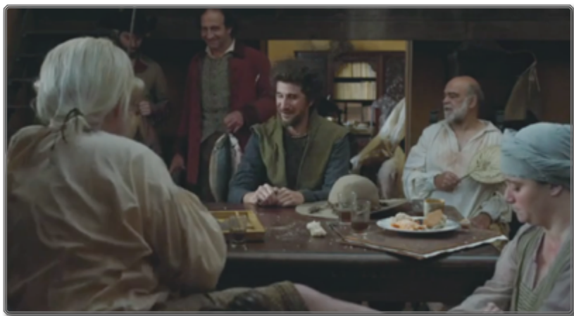
Figura 8 [00:51:13]