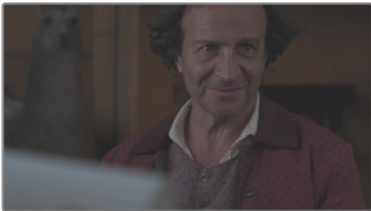
Figuras 2-3: de la esperanza a la decepción

aún, “Te mereces un beso... ahora no” que termina la segunda visita (plano 148). Lo mismo pasa con los gobernadores de los que depende la carta para pedir el traslado de Zama a la ciudad de Lerma: cuando el primero le lee a Zama la carta del Rey, se trata de anunciarle la partida del gobernador, y de Ventura Prieto a Lerma, y cuando el segundo decide redactarle la carta le precisa que “En un año o dos enviaremos la segunda... su Majestad no atiende estos pedidos hasta la segunda vez...”. Estas escenas que se duplican producen una sensación de repetición que proviene de la puesta en escena, de la repetición de frases (un procedimiento recurrente a lo largo de la película) y de la expresividad del actor que subraya su decepción y hasta su desesperación, subrayada por la banda de sonido y en particular la irrupción del shepard tone .