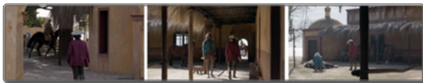
Figura 4 [00:43:03; 00:43:10; 00:43:59]

Así como el disparo del revólver ha acabado con la vida del caballo, el recado del mensajero aniquila de forma cruel las esperanzas del asesor letrado. Una escena que, por el registro cómico entendido gracias al tono de la voz del mensajero, las frases sin terminar y por la repetición de las mismas, pero también por la vestimenta del esclavo, culmina en un registro fatídico con la muerte del animal. En ella, pasamos, en un primer lugar, del tono autoritario y grave de Zama a lo cómico del personaje del mensajero. Mientras que, en un segundo lugar, pasamos de lo cómico a lo dramático introducido por el sonido del disparo y por la imagen agonizante del caballo. El animal que parecía gozar de buena salud en el plano de apertura de la escena, ya que lo observamos galopar enérgicamente, ha sido aniquilado por el jinete, de igual manera que serán aniquiladas las esperanzas de Zama en la escena siguiente. Ahora bien, si establecemos una relación metafórica entre el caballo y Zama, podemos entender que este animal, en aparente buena condición física, ha sufrido los caprichos de la autoridad, es decir del jinete que llevaba sus riendas y que tenía entre sus manos el destino, el rumbo del animal y que sin razón aparente ha decidido quitarle la vida. La imagen simbólica de apertura deja indicar que Zama pareciera seguir los pasos del animal.