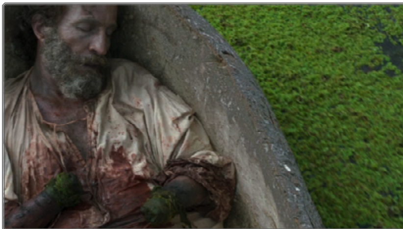
Figura 4: el final de Zama

del traslado del personaje, con una trama secundaria que se vuelve principal al final, es decir la búsqueda de Vicuña Porto, cuyas fases se perciben mediante la sucesión de gobernadores y el motivo de la petición de la carta. También sirve aquí para seguir el hilo de la historia el paulatino cambio en la apariencia física de Zama desde el inicio hasta el final del relato, es decir desde su apariencia de personaje principal del sistema colonial hasta su perdición y final adentramiento en la selva: no deja de tratarse de un recorrido vital para el personaje, a pesar de todo, ya que la última pregunta que él conteste de manera positiva es “¿Quieres vivir?”.