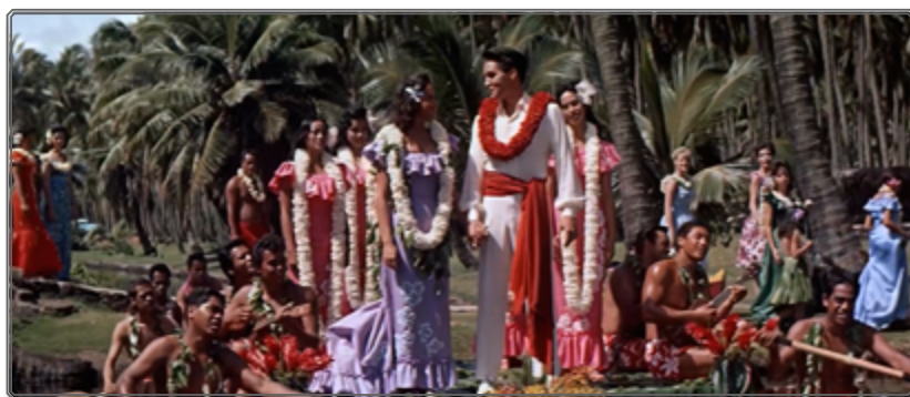
Figura 3: Elvis Presley en Blue Hawaii (Norman Taurog, 1961)

Desde el punto de vista del montaje, la música preexistente pide una escucha consciente, no acompaña la narración ni subraya empáticamente los sentimientos de los personajes. Por el contrario, al irrumpir de manera abrupta y con un nivel sonoro elevado, los fragmentos anacrónicos de una música pseudoparadisiaca fabricada por compositores europeos o americanos y tocados por verdaderos indígenas disfrazados de sí mismos sobrecogen al espectador y producen un distanciamiento que lo saca del pacto ficcional, un pacto por cierto también puesto en entredicho por otros elementos visuales y sonoros que se oponen a la narración clásica —encuadres y montaje dificultando la comprensión de la organización espacial, banda de sonido a veces en desfase respecto a la imagen con disociación de la ocularización y de la auricularización entre otros. Dichos fragmentos asocian estrechamente la época colonial con una América Latina del siglo XX, exótica, globalizada, inventada, que a la vez hace eco 23 y se opone al relato visual y a los diálogos que aparecen en la película. Invitan pues al espectador a entender que la sociedad fundamentalmente desigual, injusta y corrupta evocada en la película sigue existiendo en las estructuras de poder de los siglos XX y XXI, lo que por cierto mostró la cineasta en su trilogía fílmica anterior.