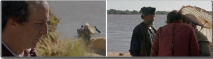
Figura 6 [00:10:16; 00:10:28]

La introducción turbia de ese cuerpo enfermo, dentro del mismo plano (donde se observa de forma nítida a Diego de Zama), sirve simbólicamente como elemento anunciador y premonitorio. En efecto, bajo la forma de una sombra que avanza progresivamente hacia la imagen de Diego de Zama, hasta alcanzarlo, el cuerpo del Oriental se entiende como la “muerte” metafórica que acecha al personaje principal. En el plano siguiente, observamos a Zama recibiendo —con doble beso— a este hombre cuyo cuerpo delata los síntomas de su enfermedad: débil, pálido, semblante febril y agotado.