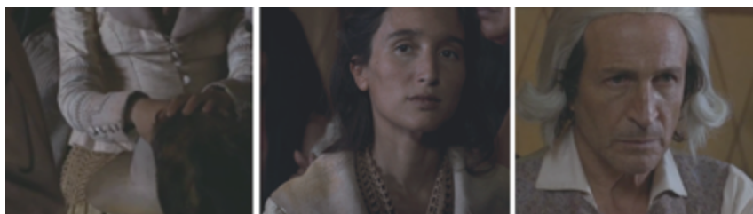
Figura 2 [00:31:53; 00:32:04; 00:32:09]

Sin pensarlo dos veces, el asesor letrado promete a la familia de la joven que “indios no les faltarán” y que pueden ir en paz, comprometiendo la palabra del gobernador. Constatamos en esta escena que el representante de la corona, autoridad de la ley, no actúa en relación con las leyes y se deja llevar por el impulso y el deseo que siente por la joven mestiza. Al constatar el error cometido ante la ley, Ventura Prieto, le pide explicaciones y trata de hacerlo entrar en razón al darse cuenta de que legalmente la decisión tomada por Zama se encuentra en los márgenes de la legalidad. Sin embargo, al final, quien ha sido “protegido” 28 por la autoridad de la corona ha sido quien está infringiendo la ley.