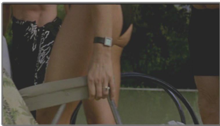
Figura 1: Fotograma sacado de la secuencia inaugural de La ciénaga

En la secuencia inaugural de su ópera prima La Ciénaga , Lucrecia Martel pone en escena unos cuerpos o porciones de cuerpos de mediana edad, desgastados. Sus manos agarran copas de cristal, llenas de vino y de cubos de hielo. Cada uno de los personajes arrastra una silla al borde de una piscina de aguas turbias, llena de hojas secas. Durante sus desplazamientos, podemos observar sus bañadores, accesorios y gafas de sol, pero muchas veces, tienen la cabeza cortada por el encuadre elegido.