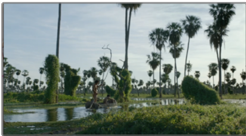
Figura 1: Zama , [1:04:00] 8

palmeras desubica a Zama, lo pone fuera de lugar según una función catafórica del paisaje señalada por Jens Anderman en su libro sobre el nuevo cine argentino 7 .