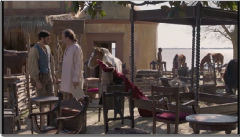
Figura 3: Fotograma de Zama [01:00:39]

Para proponer su versión del entorno colonial y evitar la vía fácil, la cineasta recurrió a decisiones arbitrarias como rechazar las velas o el fuego para reproducir la luz de la época. Estos desafíos de creación contribuyen a la personalización de la propuesta final y permiten limitar la redundancia con las convenciones establecidas, sacando al espectador de la zona cómoda de la identificación demasiado obvia.