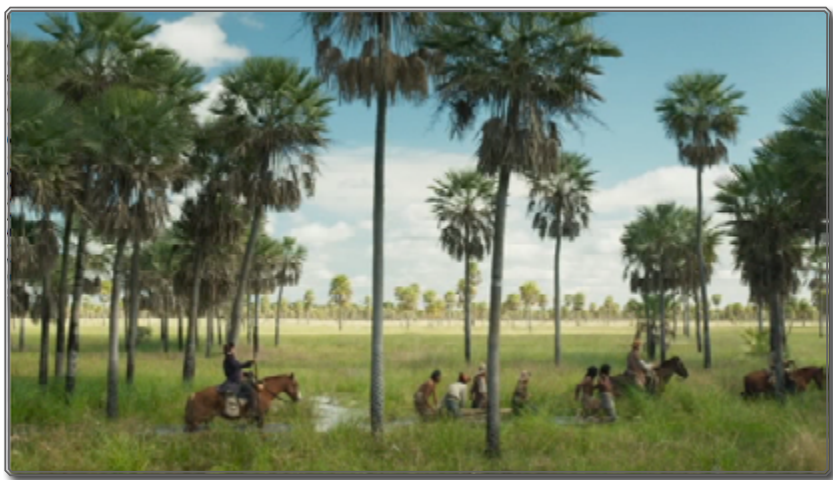
Figuras 7-8: un paisaje más estético que referencial

Así pues, puede observarse una dinámica narrativa general que lleva a Zama a ser tragado por el imaginario ahistórico de la jungla. Si bien la parte final de la película se enmarca en la subtrama de la persecución de Vicuña Porto, ésta también tiene su propia estructura y progresión, que lleva a una serie de callejones sin salida para el personaje: la búsqueda y el encuentro de Vicuña Porto, que se produce bastante al principio de esta parte final, en la secuencia nocturna en la que los indígenas acechan a los soldados; la enfermedad del soldado, mordido por una araña, cuya herida va a irse deteriorando; la presencia de los indígenas, con sus máscaras de pájaros y la reclusión de los españoles en un lugar imposible de ubicar; el esfuerzo de los españoles por escapar: cuando el soldado herido le dice a Zama en plano medio corto y voz baja “Tengo un plan. Su majestad nos recompensará”, Zama le mira de forma incrédula justo antes de que un hombre a caballo lo ahogue en el agua del río. El efecto de derealización del relato llega a su punto álgido en esta parte, en la que el decorado cobra un valor mucho más pictórico que referencial 24 .