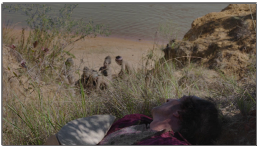
Figura 2: La mirada del mirón [00:03:27]

Los signos contradictorios que emite el cuerpo de Zama no convierten la espera en una pura pasividad o inmovilidad, quizá más tangible en la obra de Di Benedetto, sino en una serie de impulsos hacia un movimiento o acción truncados, que indican tanto la desagregación de la identidad como una dilución de la voluntad del personaje. El propio encuadre fijo, a la vez que priva al personaje y al espectador de la visión de un más allá, refleja esta tensión entre un posible movimiento y su frustración, condenándolo al inmovilismo.