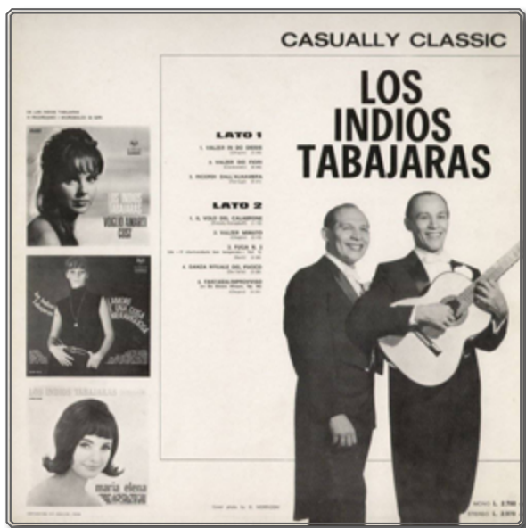
Figura 2: Smoking y música clásica

La leyenda descabellada –repetida ad nauseam en la web– construida alrededor de los dos indígenas del noreste de Brasil es reveladora 13 . Según dicho relato, se supone que no tuvieron ningún contacto con la música occidental ya que pertenecerían a una tribu apartada de la “civilización” del Estado de Ceará. Habrían encontrado una guitarra en la selva “a finales de la década de los 30” y habrían aprendido a tocar solos en un primer momento –después de comprobar que la guitarra no era ningún arma– para después tomar clases en Río de Janeiro hasta conseguir un nivel de maestría impresionante 14 . Cabe recalcar que tras despojarse de sus atributos indígenas (en particular de sus nombres) recuperan su vestuario indígena para producirse en los escenarios del mundo, creando una imagen exótica sobrecogedora para la promoción de su obra. Su segunda grabación, María Elena en 1957, una canción de 1932 del compositor mexicano Lorenzo Barcelata 15 , obtuvo un enorme éxito en el marco de una música tropical elaborada para el gusto de un público latinoamericano, acostumbrado a los boleros de las coproducciones mexicano-cubanas, también recuperados por el cine hollywoodiense mediante traducciones al inglés. Los hermanos fueron contratados por la compañía discográfica RCA y se marcharon a Estados Unidos donde grabaron 48 álbumes cambiando de atuendo en función de la música que tocaban: smoking para música clásica y plumas, collares para interpretar éxitos populares.