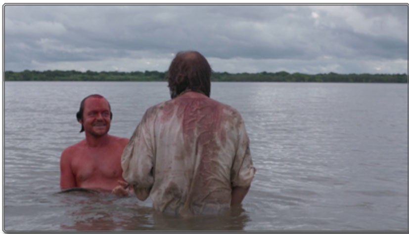
Figura 7: Vicuña Porto, encarnación de la alteridad [01:38:16]

El encuentro entre los dos antagonistas, lejos de generar un enfrentamiento, elabora al contrario un reconocimiento mutuo, basado en el entendimiento común de la escisión de la identidad, convertida solo en un nombre (“si no dices mi nombre vivirás”), que como en el caso de la leyenda escapa al control y a la verdad. A pesar de que Vicuña —como el hijo del Oriental— se apropie la espada de Zama, imponiendo su secreto a través de la amenaza, la propia pasividad del antiguo corregidor le acabará convirtiendo en un aliado de los dos bandos y, al final, en un “traidor” de ambos.