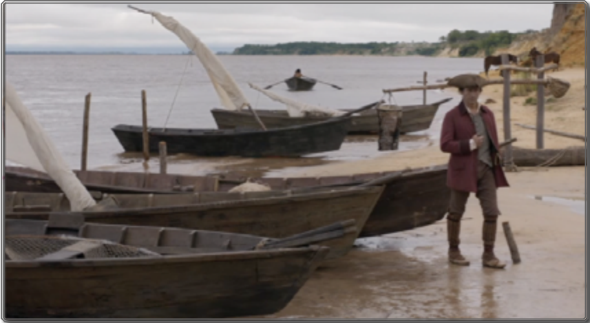
Figura 3: Zama , [00:50:00]