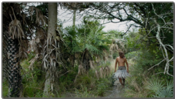
Figura 7: Un guaycurú en la selva tropical

Ese desajuste altera la imagen paulatinamente, hasta el clímax que constituye la última parte de la película en la que los intrusos –las autoridades coloniales y sus súbditos– se pierden en el Gran Chaco, esa extensa llanura boscosa que es el segundo bosque del planeta después de la selva amazónica. Después de una elipsis señalada por el trastorno físico y psíquico del personaje de Zama, con barba crecida, flaco y a rato delirante, que se suma a un grupo de voluntarios para adentrarse en las tierras de los temibles indígenas libres, los guaycurúes, con el objetivo de terminar con Vicuña Porto y así sanear las rutas para el comercio. Se opera un cambio brutal porque el protagonismo y el poder quedan en manos de las y los indígenas. Una vez que los representantes de la Corona se quedan sin sus monturas, desaparece la soberbia y la posibilidad de cualquier acto heroico, y pronto pierden el juicio, cuando no la vida.