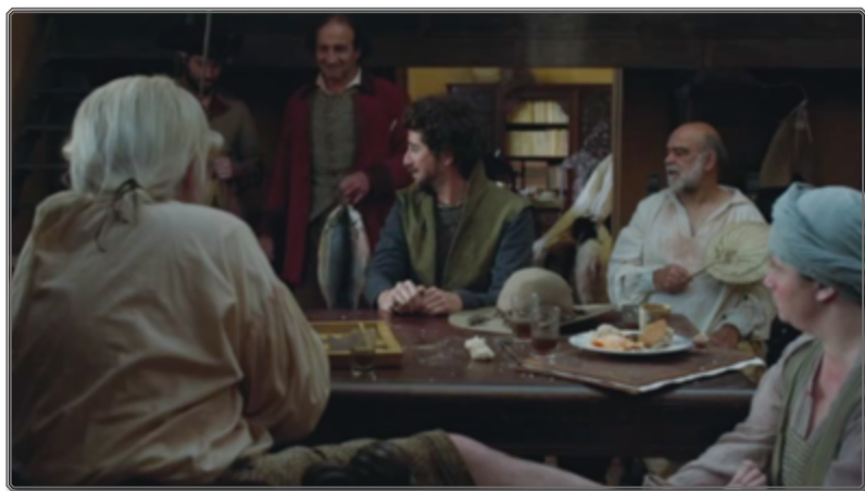
Figura 2: [00:51:12]

La primera aparición del segundo gobernador se presenta asimismo como un momento de suspensión diegética propicio para el afloramiento de una lógica icónica en la imagen fílmica. La escena empieza de nuevo con un plano fijo bastante largo que dura 24 segundos (fig. 2).