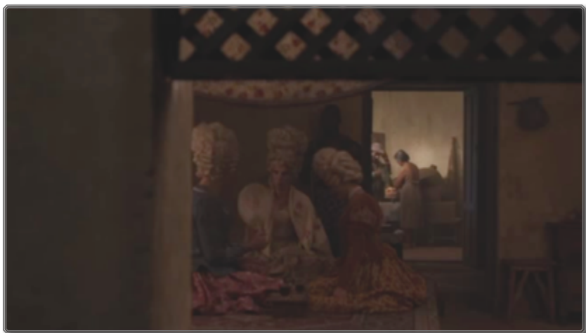
Figura 1: [00:16:17]

© Rei Cine SRL, Bananeira Filmes Ltda, El Deseo DA SLU, Patagonik Film Group SA 8