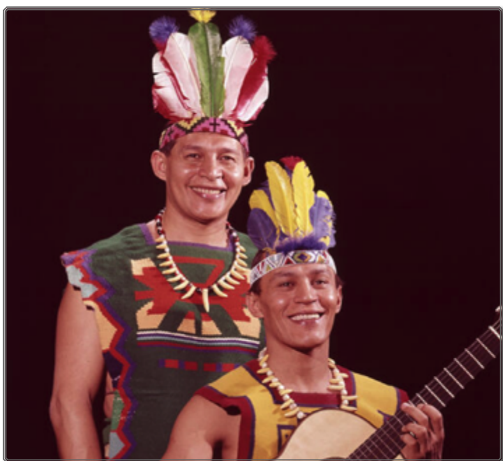
Figura 1: Los Indios Tabajaras

En Zama la música se integra en un trabajo global muy elaborado de la banda de sonido realizada por un equipo dirigido por Guido Berenblum 11 y que forma un continuum sonoro y musical en el que participan tanto los cantos de los pájaros como los chirridos de los insectos electrónicamente transformados, sin olvidar por supuesto el Tono de Shepard-Risset que hemos evocado previamente. En dicho conjunto, los fragmentos de las siete obras tocadas a la guitarra por los hermanos Tabajaras, inicialmente Mussapere y Herundy convertidos por el marketing en Antenor y Natalicio (Nato) Moreyra Lima, intervienen en nueve ocasiones con duraciones muy breves 12 —menos de un minuto— excepto para las dos últimas citas que se prolongan a lo largo de los títulos de crédito finales.