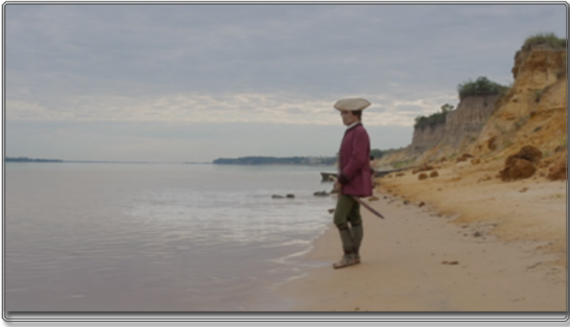
Figura 1: La crisis existencial de Don Diego de Zama

Sus tensiones y contradicciones, así como su comportamiento, ilustran la crisis existencial que atraviesa y que se remite también a otra escala, al caos político e ideológico que agitaba el imperio de ultramar a finales del siglo XVIII. A los hijos de padres europeos o africanos nacidos en el Nuevo Continente, eso es los americanos, se les llamó criollos —un término cuya etimología explica en parte cierta confusión en el uso de la palabra, sinónima de amalgama, y que utilizó Garcilaso de la Vega en 1609 en sus Comentarios reales sobre el origen de los yncas . No debe confundirse con las palabras mulatos o mestizos que distinguen a las personas de “raza mezclada”, hijos de españoles con negra o indígena, según el discurso de castas que fue una herramienta de dominio colonial y sirvió para asentar los privilegios de los que se beneficiaban los gachupines , eso es los peninsulares. Los criollos padecían el desdén y los prejuicios de los peninsulares, cuya percepción venía asociada a unas concepciones colonialistas europeas del medio geográfico, que vino a constituirse en una teoría de la degeneración a partir del siglo XVIII: