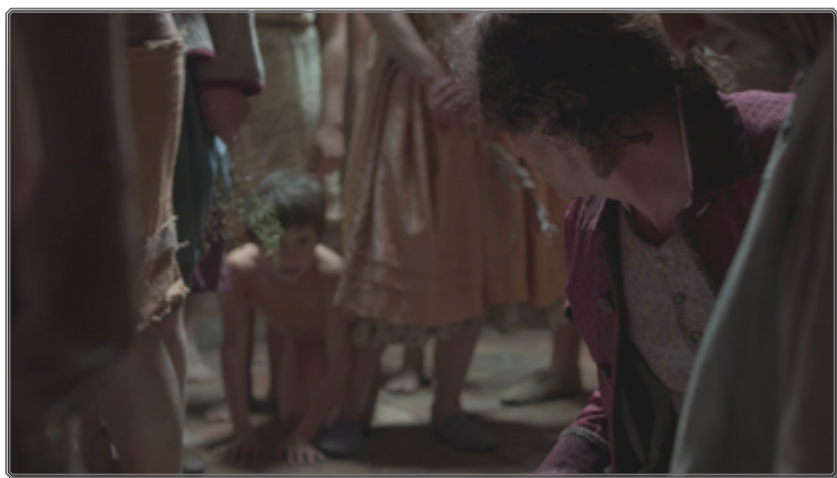
Figura 6: El niño muerto en el inframundo [00:22:24]

La siguiente aparición del niño muerto, durante la visita de Zama al médico Palos, sigue sin embargo relacionada con las anteriores. La película opera otra condensación narrativa en relación con la novela, ya que la casa en la que ejerce Palos se convierte en el lugar donde la sanadora indígena realiza sus rituales de curación. Al entrar Zama en busca del médico, una mujer le indica la presencia del “santito niño muerto”, mientras que otra confirma: “Está el santito ahí”. Al contrario de lo ocurrido hasta entonces, la representación del niño está aquí dotada de corporalidad, aunque Zama deba franquear un primer umbral de la visibilidad, en otra modalidad del encuadre. Cuando atraviesa la ceremonia indígena orquestada por la sanadora para alcanzar al doctor Palos, que se encuentra en la esquina opuesta del encuadre, este se desmorona, seguido por la cámara que pasa a estar a nivel del suelo, por debajo de la cintura de los participantes. Entre el bosque de piernas, se encuentra el niño muerto, alejándose. Zama, sorprendido, lo llama, pero es interrumpido por el ruido de los ramos que sostienen los presentes, agitados al unísono, como para alertarle de que su búsqueda debe detenerse ahí.