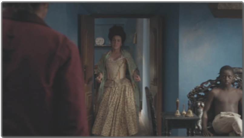
Figura 4: Fotograma de Zama [00:41:28]