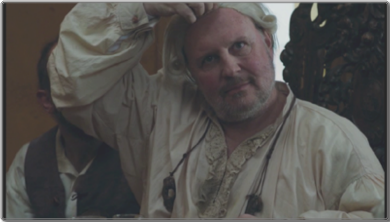
Figura 5: Fotograma de Zama [00:55:27]

del vestuario y accesorios la regla del “sentido común” 32 . En un principio, subrayamos un desfase: los uniformes de trabajo son más lujosos que los lugares ocupados por los burócratas. Una rica gama cromática, con declinaciones de verdes y rojos principalmente, nos permite diferenciar a los distintos trabajadores de la corona. Añadieron muchos detalles sugestivos. Quisieron romper con la masculinidad estereotipada con ornamentos y comportamientos afeminados –uñas, telas floridas, besos, proxémica– para cuestionar el consagrado heroísmo del macho. Además, Pinheiro añade: “Tampoco queríamos un pasado monocromático y en tono sepia” 33 . Este lujo aparente de los motivos y materias de la tela 34 se disuelve rápidamente cuando se empieza a ridiculizar a este grupo social, con clara intención de expresar lo patético, rozando lo burlesco. El personaje del segundo gobernador se distingue por su fatuidad. Largos planos fijos del más poderoso de los burócratas permiten una observación detallada de este singular personaje.