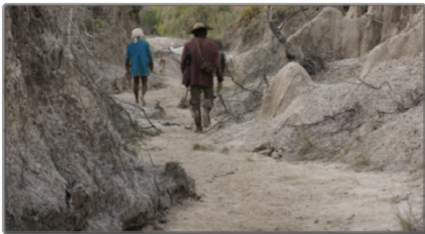
Figura 4 : Zama , [00:77:00]

Entre el estreno de Zama en Venecia en 2017 y la travesía fluvial previa, hubo varios años de trabajo. Como si se tratara de un relato onírico, el origen del proceso creativo de la escritura del guión está olvidado, perdido según la cineasta :