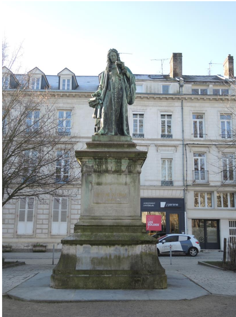
Fig. 1. Statue de Charles du Fresne du Cange, place René Goblet à Amiens.

Cette entreprise qui a occupé la Société pendant sept ans, de la fin de l'année 1842 à août 1849, est connue grâce à des sources de documentation exceptionnelles conservées dans la bibliothèque de la SAP ; dès sa fondation, la SAP a accordé un soin particulier à toutes ses archives, reliées et rangées dans une armoire de sa bibliothèque : comptes rendus de séances, courriers divers, factures permettent de connaître de nombreux détails qui n'ont pas toujours été repris dans les sobres comptes rendus publiés dans les Bulletins de la Société. Mais à cela s'ajoute, pour la statue de du Cange, ce que nous nommons le « monument » du Cange : un petit meuble vitré conçu spécialement pour abriter les quatre énormes volumes reliés des archives de l'entreprise du Cange. Courriers, bons de commande, factures... jusqu'aux bulletins de la souscription lancée pour recueillir les fonds nécessaires à la construction de la statue et aux affiches annonçant les festivités proposées lors de l'inauguration ! Cela témoigne de l'intérêt que présentait, au XIX e siècle, Charles du Fresne du Cange pour les membres de la Société.