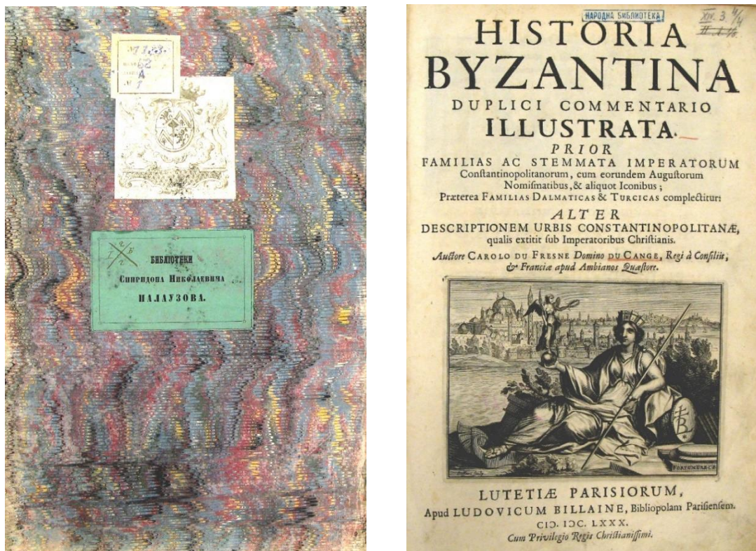
Fig. 1. L'exemplaire de l' Historia Byzantina possédé par Spiridon Palaouzov.

On peut également remarquer que la famille régnante, celle de la Maison de Saxe-Cobourg et Gotha, et plus spécialement le prince, puis roi, Ferdinand 1 er de Bulgarie (1887-1918) possédait des livres de Du Cange. Son exemplaire de l' Illyricum vetus et novum dut être acheté chez l'éditeur italien Léon Olschki. Après l'abolition de la monarchie, la famille royale quitte le pays en 1946, et sa collection de livres demeure dans les locaux de l'Académie bulgare des sciences ( fig. 2 ).