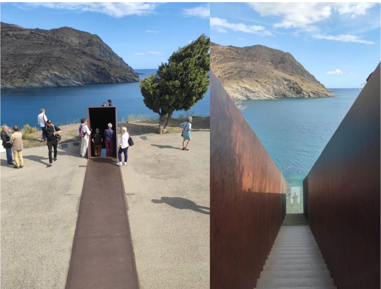
Illustration 4: Mémorial Walter Benjamin, septembre 2021.

D'ailleurs, je retiens les mots de cette voix, Anne, qui s'exprima à la toute fin des discussions lors du tour de table : « En fait, il s'est passé quelque chose d'assez étonnant, c'est que ces deux journées passionnantes m'ont donné l'occasion d'avoir honte. Il se trouve qu'il y a quelques années, j'ai eu à enseigner les textes de Benjamin, évidemment les textes les plus classiques. Et, en réalité, ces deux journées m'ont fait complètement réviser la façon que j'avais de comprendre certains pans de la personnalité de Benjamin. [...] À travers sa parole sur et à la radio, il me semble que j'en ai appris plus que par les textes théoriques que je connaissais ». La question de la présence des voix et de leur écoute me semble posée une fois de plus et elle vient bousculer notre rapport au monde : quelle place laisse-t-on aux voix pour qu'elles existent parmi nous au sein de notre monde ?