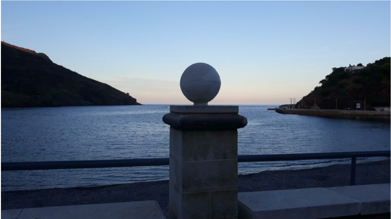
Illustration 2: Portbou, septembre 2021.

El tiempo abierto, y su después / Le temps ouvert, et son après.