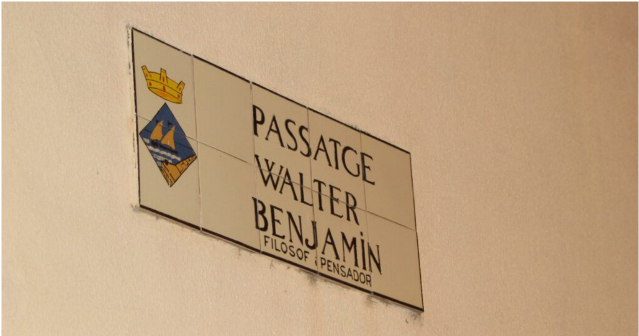
Illustration 5: Photo de Giuseppe Gavazza, Portbou, septembre 2021.

Du haut de ma cabine de train, je décide que mon récit s'arrêtera au paragraphe précédent où la métalepse doit faire son effet sur le lecteur. J'espère que Madame Roche ne jugera pas trop sévèrement cette tentative d'illustrer cet effet. En attendant, l'esprit tourné vers l'est, là où la lumière s'éloigne, j'admire ses éclats sur le vaste champ de vagues en contrebas et qui finit par se confondre dans l'horizon azur du ciel : j'ai l'impression de me faufiler discrètement dans cet air empli de soleil (et de voix bruissantes). Depuis quelques minutes déjà, je n'aperçois plus de villes, ce sont des ports et de petites communes qui se succèdent, peu ou pas de routes, juste des rails, des rochers à pic et des criques. J'ai l'étrange sensation de me trouver dans un entre-deux, pris dans un passage. Il y a environ 70 ans, Walter Benjamin vivait ses dernières heures en tentant de traverser la frontière espagnole pour fuir la France et les forces nazies. Cette histoire aussi résonne encore aujourd'hui.