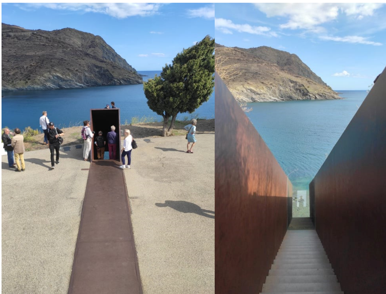
Illustration 4: Mémorial Walter Benjamin, septembre 2021.

D'ailleurs, je retiens les mots de cette voix, Anne, qui s'exprima à la toute fin des discussions lors du tour de table : « En fait, il s'est passé quelque chose d'assez étonnant, c'est que ces deux journées passionnantes m'ont donné l'occasion d'avoir honte. Il se trouve qu'il y a quelques années, j'ai eu à enseigner les textes de Benjamin, évidemment les textes les plus classiques. Et, en réalité, ces deux journées m'ont fait complètement réviser la façon que j'avais de comprendre certains pans de la personnalité de Benjamin. [...] À travers sa parole sur et à la radio, il me semble que j'en ai appris plus que par les textes théoriques que je connaissais ». La question de la présence des voix et de leur écoute me semble posée une fois de plus et elle vient bousculer notre rapport au monde : quelle place laisse-t-on aux voix pour qu'elles existent parmi nous au sein de notre monde ?