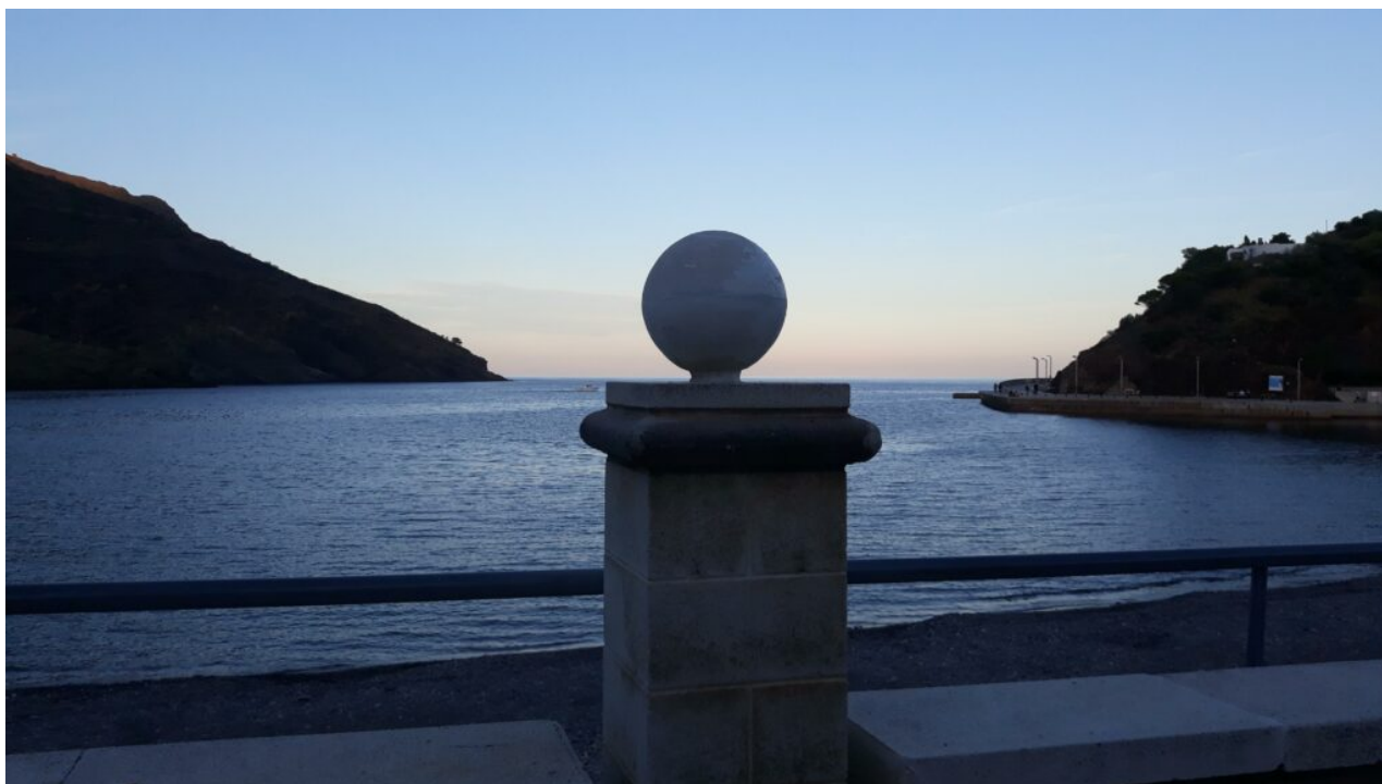
Illustration 2: Portbou, septembre 2021.

El tiempo abierto, y su después / Le temps ouvert, et son après.