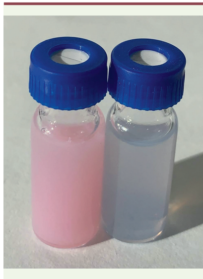
Figure 2. Solutions contenant du chlorure de cuivre ( CuCl_2 ) et LCC-12 (à gauche) ou uniquement CuCl_2 (à droite).

cuivre mitochondrial contrôle la plasticité des macrophages, mais également celle d'autres cellules : c'est donc un acteur central de la plasticité cellulaire. La spectrométrie de masse a également révélé l'existence d'une augmentation du contenu mitochondrial en manganèse au cours de l'activation des macrophages, ce qui suggérerait l'implication de la superoxyde dismutase mitochondriale dépendante du manganèse (SOD2), dont la quantité, ainsi que celle du peroxyde d'hydrogène ( H_2O_2 ) qu'elle produit, augmente effectivement dans les mitochondries des macrophages activés. Nous avons montré que le cuivre(II) induit la réduction de H_2O_2 en présence de NADH, avec production de NAD^+ , une molécule nécessaire à la production de divers métabolites, dont l' \alpha -cétoglutarate et l'acétyl-CoA, qui sont impliqués dans le contrôle de l'activité des déméthylases et des acétyltransférases. LCC-12, en chélatant le cuivre(II), antagonise la conversion de NADH en NAD^+ , pour produire à la place l'époxy-NADH, relativement instable. En présence de LCC-12, nous avons effectivement détecté une