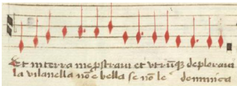
Guillaume I-Bc Q. 15, n° 34, f. 38r, Contratenor