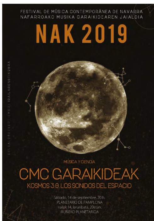
Fig. 1 – Programme du festival NAK 2019.

Spin 5/2 est une commande du festival espagnol NAK pour un événement au planétarium de Pampelune sur le thème de l'astrophysique et plus particulièrement de l'origine du temps. Elle associe un quintette instrumental à un dispositif électroacoustique synchronisant et diffusant des sons préenregistrés dans le dôme hémisphérique du planétarium, en parallèle avec une vidéo créée pour l'occasion en image 3D hémisphérique par l'artiste espagnole Sandra Vallejo.