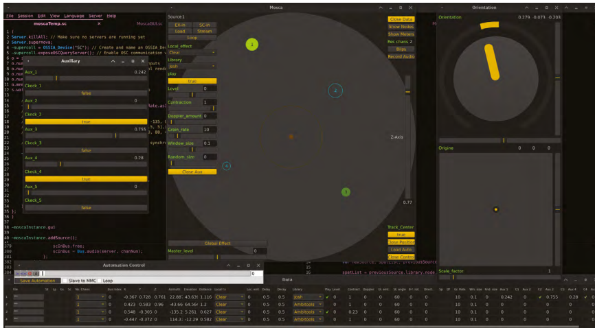
Fig. 4 – Spatialisateur 3D Mosca.