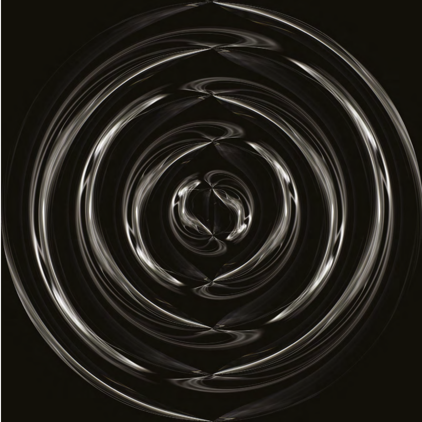
Fig. 2 – Exemple d'image synthétisée par Sandra Vallejo.

La forme générale de l'œuvre est conduite par deux processus superposés inspirés de processus astrophysiques. Le premier processus correspond au passage d'un univers bruité à un univers inharmonique ou quasi harmonique et le second à l'accroissement puis la décroissance de l'entropie.