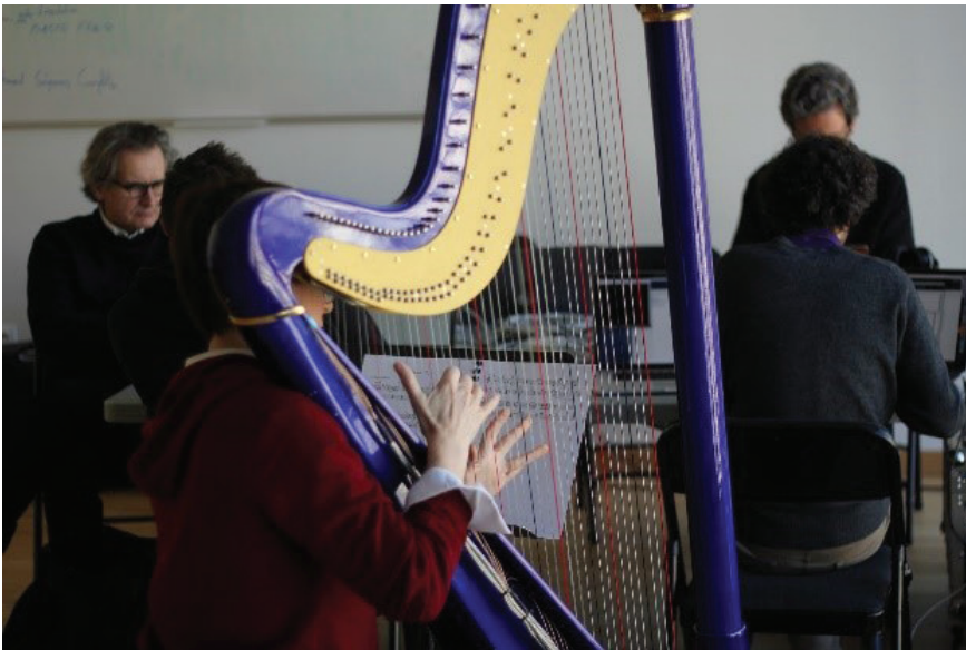
Fig. 1. L'équipe « Orbis » en résidence à l'Espace scénique transdisciplinaire (équipement culturel de l'université Grenoble Alpes).