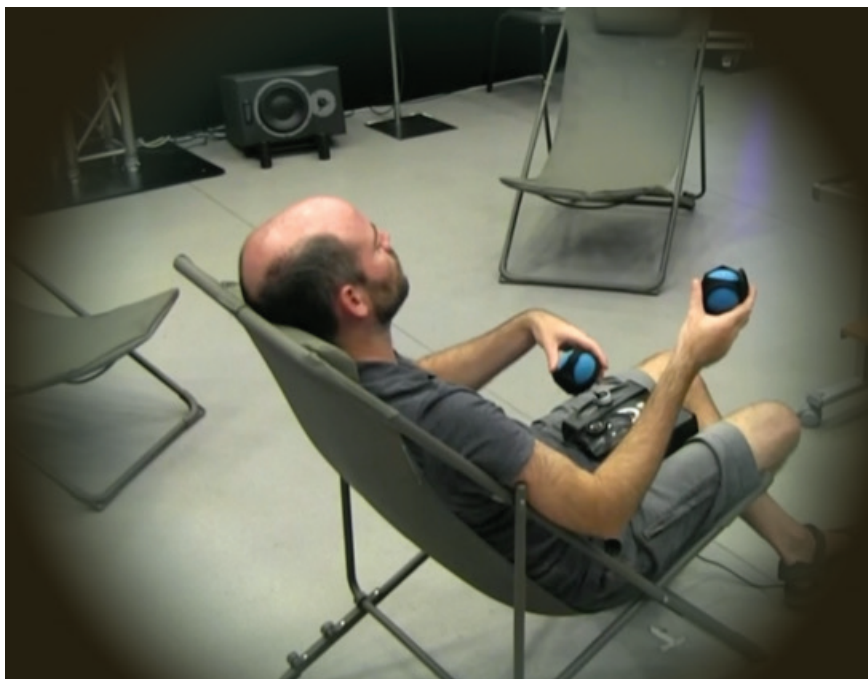
Fig. 1. Situation de jeu avec Gametrak.

Après divers essais, le choix d'un dispositif de jeu s'est porté sur un Gametrak. Cet appareil offre l'équivalent de deux joysticks, chacun lié à un fil qu'on peut tirer vers le haut, mesurant ainsi l'élévation. Les doigts restent libres mais les mains sont reliées aux fils avec des mitaines, ce qui permet de se sentir mieux orienté dans l'espace qu'avec des systèmes totalement libres, comme Kinect. L'appareil est suffisamment léger pour être placé sur les genoux en position assise, ou sur le sol si l'on reste debout ( figure 1 ).