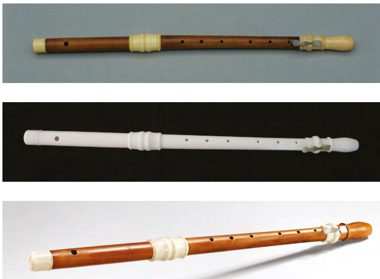
Fig. 1. Haut: Flûte Hotteterre: original (inventaire E.999.6.1); centre: reconstitution en impression 3D; bas: fac-similé réalisé par Claire Soubeyran en 2001. Collection du musée de la Musique © Cité de la musique-Philharmonie de Paris, J.-M. Angles.