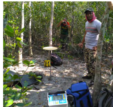
3 - Exemple d'un point de mesure réalisé dans la forêt des Sundarbans. Le couvert végétal est extrêmement dense. Nous choisissons des sites où ce dernier est moins dense afin que l'antenne GNSS capte un nombre suffisant de satellites, les arbres limitant le passage des ondes. Pour des raisons de sécurité, nous devons rester extrêmement groupés et à moins de quelques mètres des gardes forestiers armés qui nous accompagnent. car nous sommes sur le territoire d'un grand prédateur, le tigre du Bengale dont nous avons souvent croisé les traces.