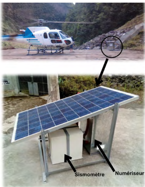
1 - Exemple d'installation pour la station RIV5.

Afin de pouvoir suivre et localiser le transport sédimentaire avec des enregistrements sismiques, nous avons déployé temporairement, de fin 2015 à fin 2022, un réseau sismique appelé Rivière des Pluies (code ZF). Il était composé de 11 stations de type large bande, dont six au niveau de la rivière des Pluies dans le nord de La Réunion, trois à proximité de la rivière du Mât dans l'est de l'île, une à proximité de la rivière d'Abord dans le sud et une à la Saline, à proximité de la côte ouest de l'île et d'un cours d'eau : la ravine des Trois-Bassins.