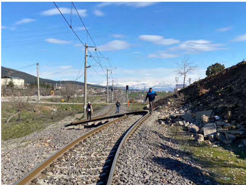
1 Déplacement latéral en surface déformant les rails à Şekeroba