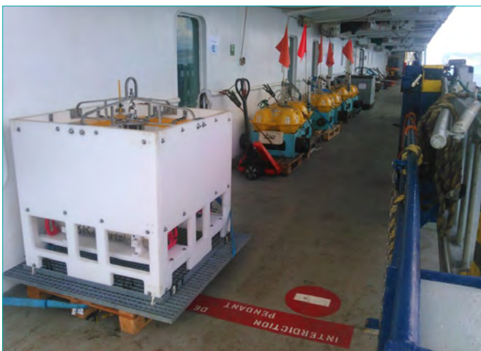
2 Le capteur A0A Résif et OBS CNRS-INSU prêts à être déployés sur le pont du navire Marion Dufresne lors de la campagne Mayobs15 à Mayotte

L'AS SMM dispose, depuis le 28 mars, d'un site web dédié où il est possible de consulter le calendrier des campagnes et de réserver des instruments. Ces deux outils seront encore améliorés dans les mois à venir.