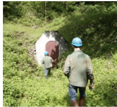
1 - Entrée de la mine accueillant la station ECH

La station ECH, implantée sur la commune d'Échery dans le Nord-Est de la France, est installée dans une ancienne galerie de mine 1, à une profondeur d'environ 30 m. Cette station est souvent considérée comme la station de référence pour