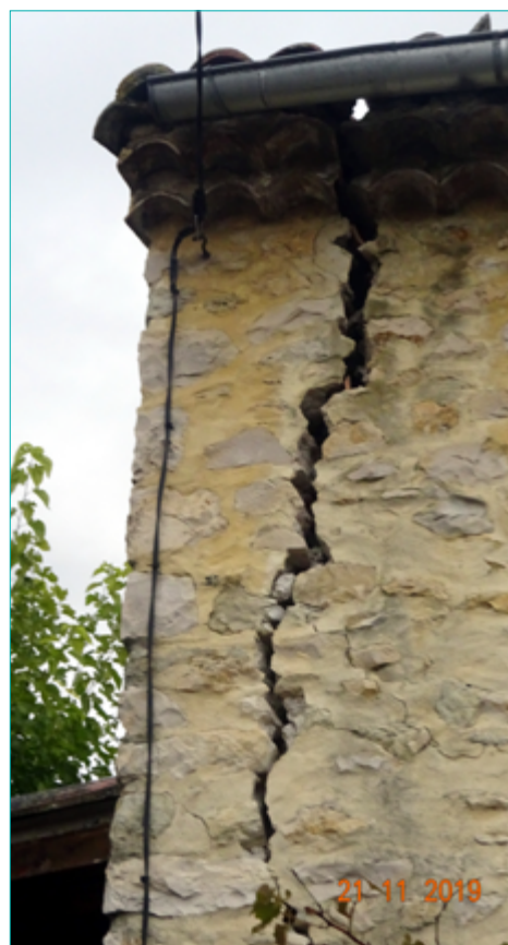
1 - Large fissure traversante dans la façade d'une habitation au Teil, suite au séisme de magnitude Mw 4.9 du 11/11/19

Cette action s'inscrit dans le cadre du SNO Renag. Elle a pour objectif de tester et analyser les méthodes et modèles d'extraction de taux de déformation à partir des vitesses GNSS dans un contexte de très faible rapport signal sur bruit. Elle com-