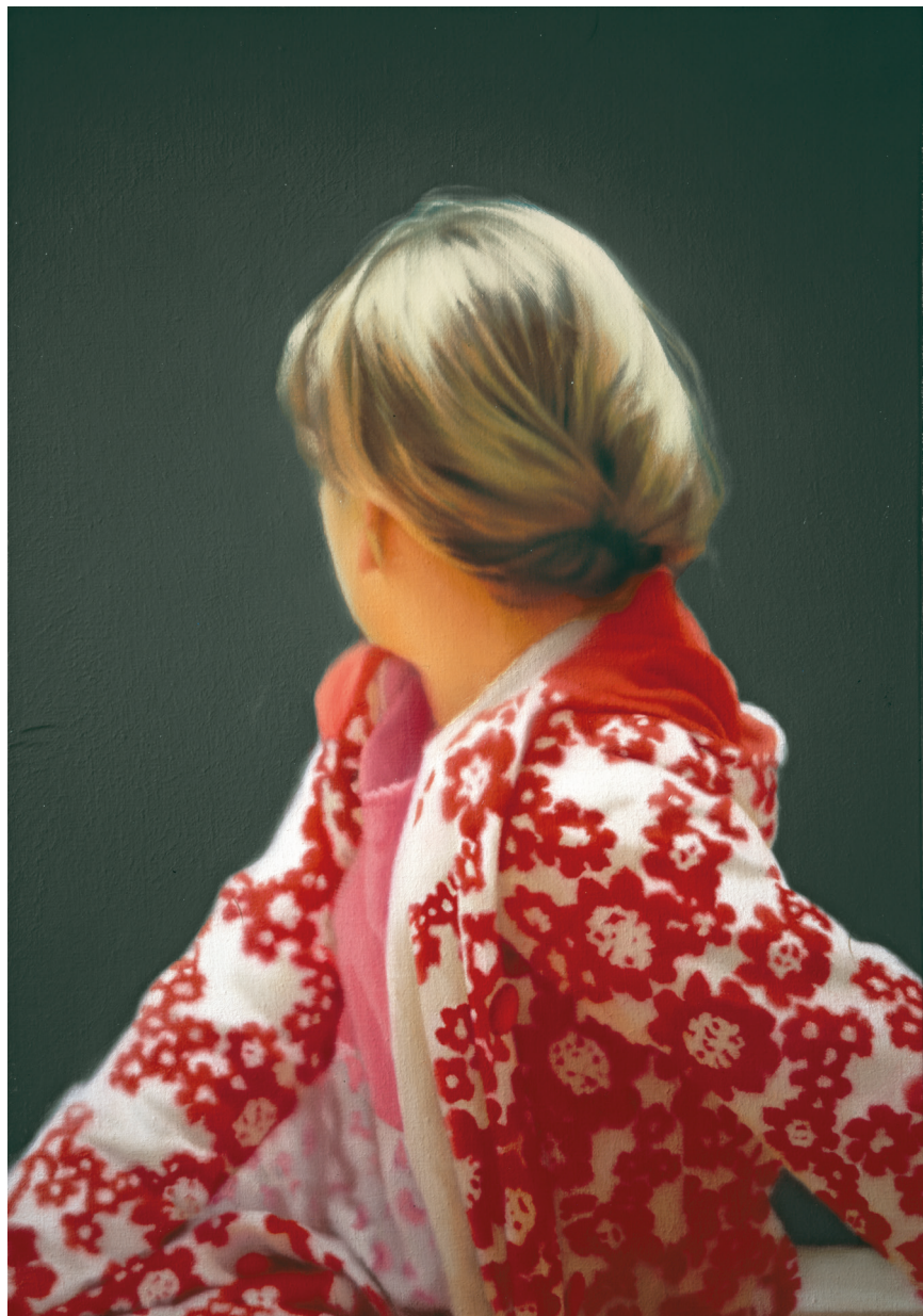
11. Gerhard Richter, Betty , 1988, huile sur toile, h. 1,02 m, L. 0,72 m, 1988, Saint Louis Art Museum, catalogue raisonné 663-5