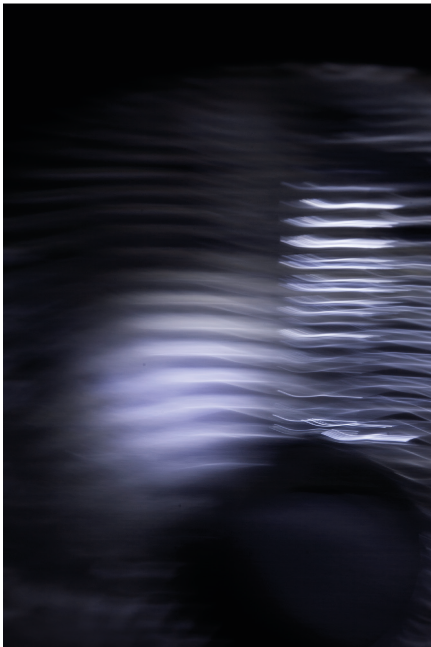
14. Shirine Gill, Untitled No.1 , photographie numérique, 2008