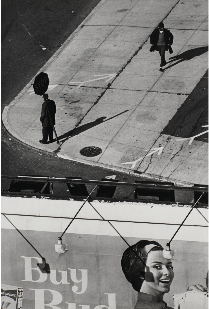
9. André Kertész, Bud. Long Island University , négatif monochrome souple au gélatino-bromure d'argent, h. 24 cm, L. 18 cm, 15 novembre 1962, Paris, médiathèque de l'Architecture et du Patrimoine