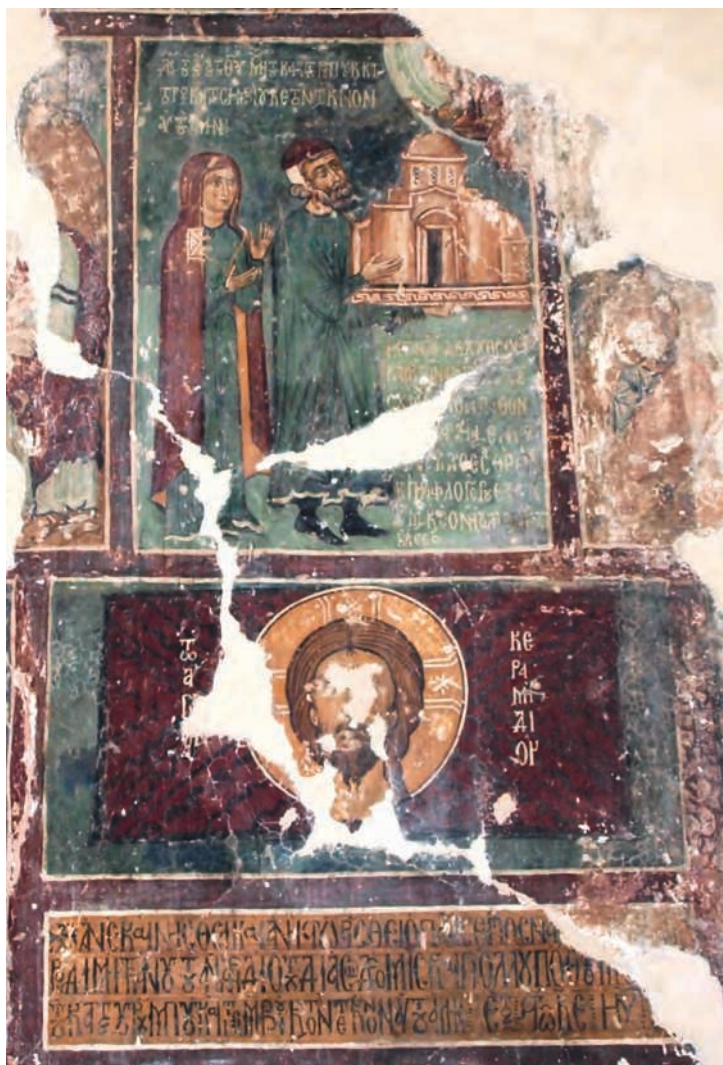
Figure 5 — Agridi-Dali, église Saint-Démétrianos, panneau dédicatoire, 1317. G. Meyer-Fernandez.

lignes en lettres noires sur fond ocre jaune, précédé d'une croix, est cerné d'une bande blanche et d'une bande rouge plus épaisse. Le panneau dédicatoire de Pedoulas se distingue de celui d'Agridi-Dali par la position agenouillée du fondateur et les portraits des enfants.