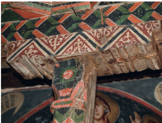
Figure 9 — Pedoulas, église de l'Archange-Michel, détail du templon , 1474. G. Meyer-Fernandez.