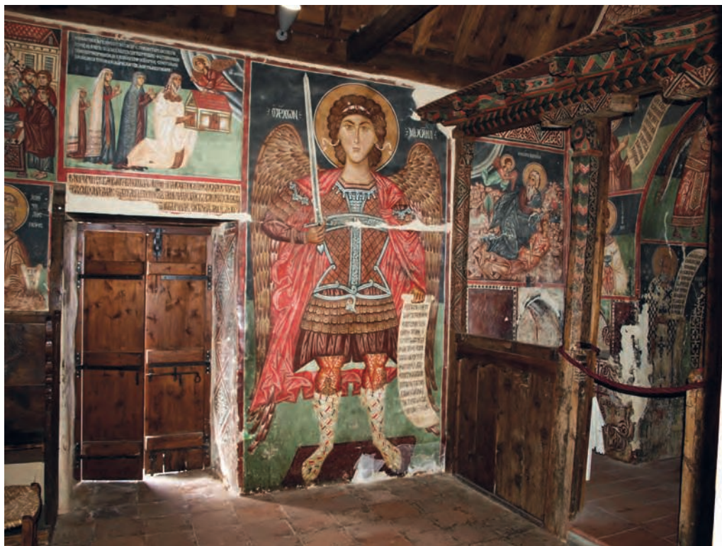
Figure 1 — Pedoulas, église de l'Archange-Michel, vue générale de l'extrémité orientale du mur nord, 1474. G. Meyer-Fernandez.

Par ailleurs, l'Archange-Michel ne semble pas avoir changé de fonction depuis sa fondation 8 . En plus d'avoir conservé l'intégralité de son décor peint, l'église possède son templon d'origine 9 , l'une des plus anciennes clôtures de sanctuaire en bois non seulement de Chypre, mais de l'ensemble du monde orthodoxe (fig. 4). En outre, deux icônes contemporaines de la fonda-