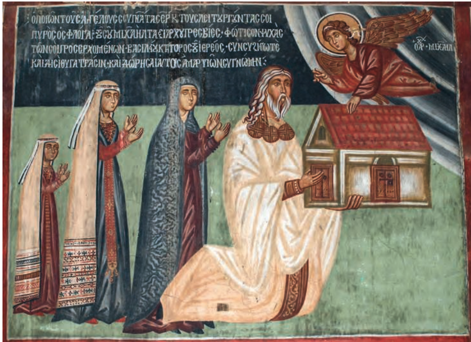
Figure 2 — Pedoulas, église de l'Archange-Michel, panneau dédicatoire, 1474. G. Meyer-Fernandez.