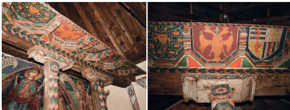
Figure 4 — Pedoulas, église de l'Archange-Michel, détails du templon , 1474. G. Meyer-Fernandez.

tion de l'église, autrefois disposées sur cette cloison, nous sont parvenues. La première figure le saint titulaire de l'église, la seconde, la Vierge Hodighitria . Cette dernière présente, dans la partie inférieure de son cadre, la signature d'un peintre nommé Minas 10 . Il s'agit de Minas de Myrianthoussa, l'artiste responsable des fresques de l'église de Pedoulas. Il a laissé aussi son nom au-dessus de la porte ouest du naos , au-dessous de la Crucifixion 11 .