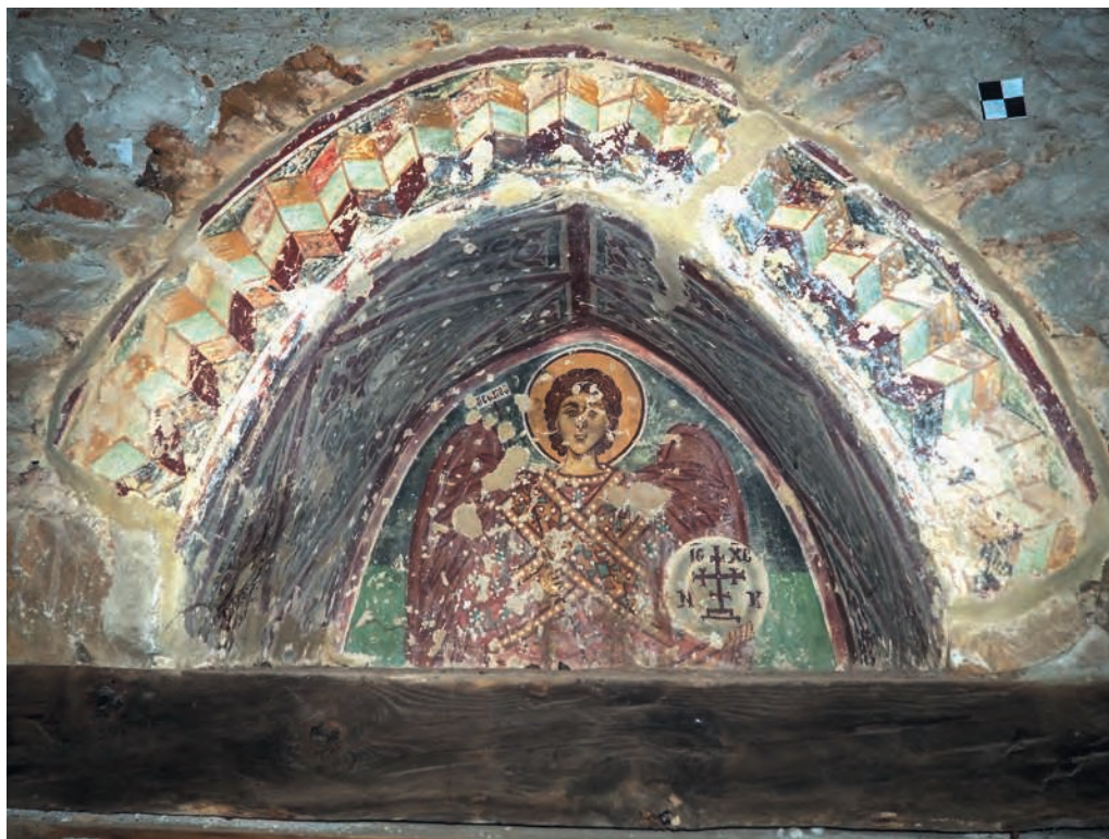
Figure 6 — Pedoulas, église de l'Archange-Michel, façade sud, niche aménagée au-dessus de la porte, 1474. G. Meyer-Fernandez.

en valeur des portraits de saints dans des églises qui, sous le règne des Lusignan, ne célèbrent pas toutes le rite grec 47 . Étant donné l'ancienneté et le caractère protéiforme du chevron au sein du répertoire décoratif local, il est hasardeux d'interpréter la peinture de Pedoulas comme la simple imitation de sculptures gothiques, comme il est réducteur de qualifier ce motif de « byzantin » ou « gothique ».