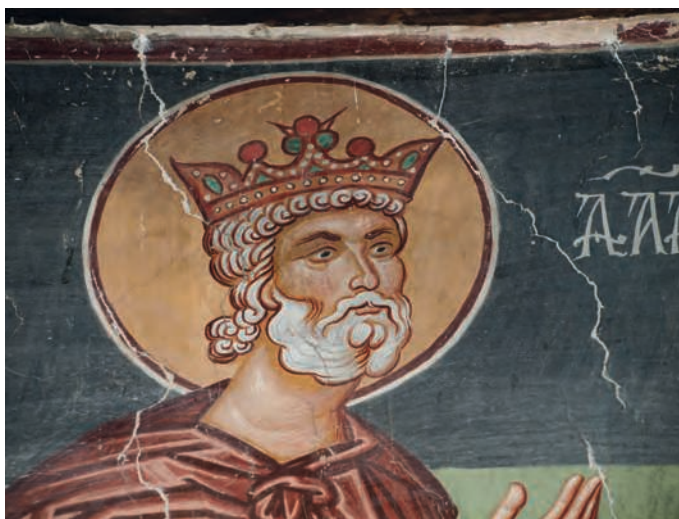
Figure 7 — Pedoulas, église de l'Archange-Michel, bèma , arc triomphal, détail de l'effigie du prophète David, 1474. G. Meyer-Fernandez.

Les rois-prophètes David et Salomon, figurés sur l'arc triomphal de l'église 53 , sont coiffés d'un diadème dont le type s'éloigne de celui adopté par les empereurs paléologues (fig. 7). Ces derniers portent en effet une couronne fermée de forme hémisphérique, munie