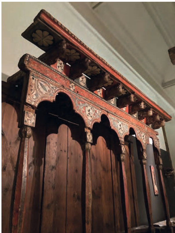
Figure 10 — Madrid, Museo Arqueológico Nacional, détail des stalles provenant du couvent Santa Clara à Astudillo (Castille-et-Léon), vers 1353. G. Meyer-Fernandez.