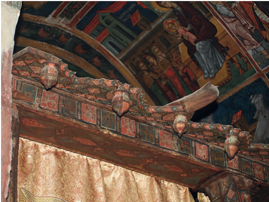
Figure 8 — Kalopanagiotis, monastère Saint-Jean-Lampadiste, église Saint-Héraclide, détail du templon , fin XIII e -XIV e siècles. G. Meyer-Fernandez.

L'analogie entre les églises de Pedoulas et Kalopanagiotis, distantes d'environ 6 km, est frappante lorsque l'on observe leur templa , qui partagent plusieurs éléments structurels et décoratifs. Réalisé entre la fin du XIII e et le XIV e siècle, le templon de Saint-Héraclide 107 est aussi composé d'un épistyle étroit sur lequel est posée une corniche projetée (fig. 8). Il présente également un décor héraldique peint sur sa partie sommitale et met à l'honneur les armoiries des Lusignan qui apparaissent au-dessus des portes menant au bèma . Comme à Pedoulas, l'emblème royal est associé à l'aigle bicéphale. Il est fort probable que la cloison de Pedoulas fasse référence à celle de Kalopanagiotis, l'un des plus anciens et prestigieux sanctuaires des