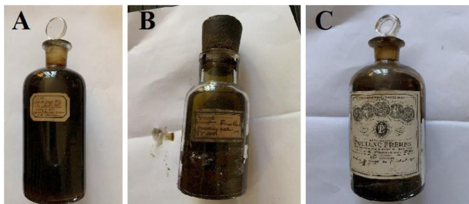
Figure 2. Bouteilles de yagé retrouvées au domicile du pharmacien français Alexandre Rouhier. A. Bouteille contenant un liquide et étiquetée « teinture de yagé » au 1/5 (alcool à 70°) yagé du Putumayo, proven. Pinto Valderama. B. Bouteille contenant des feuilles de yagé et étiquetée « yagé feuilles épuisées par l'alcool ». C. Bouteille contenant un liquide et étiquetée « teinture de yagé » au 1/5 (alcool à 70°) 250 grammes.

données sur les analyses de boissons à l'ayahuasca conservées sur une très longue période [11–13].