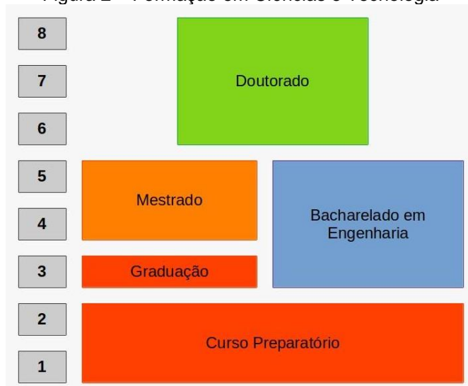
Figura 2 – Formação em Ciências e Tecnologia

em matemática, em apenas mais um ano estaria graduado, uma vez que os esse curso de graduação na França tem duração de 3 anos. A Figura 2 traz um esboço da trajetória acadêmica possível para uma formação em Ciências e Tecnologia.