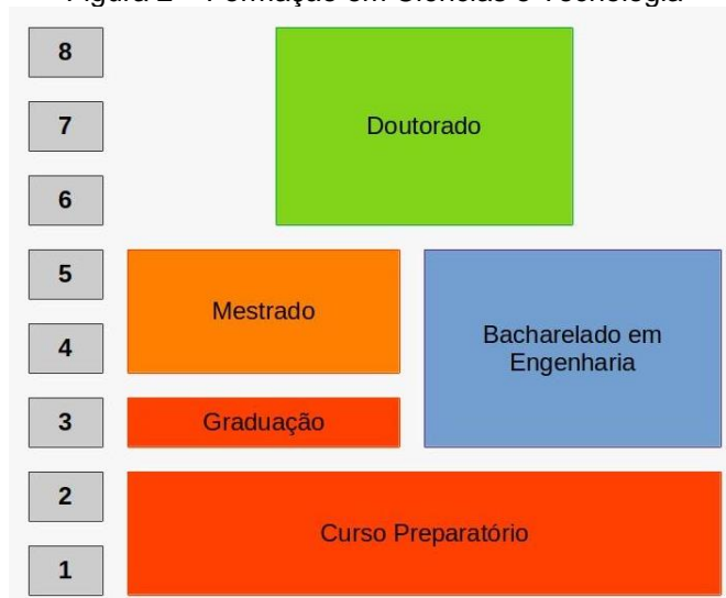
Figura 2 – Formação em Ciências e Tecnologia

em matemática, em apenas mais um ano estaria graduado, uma vez que os esse curso de graduação na França tem duração de 3 anos. A Figura 2 traz um esboço da trajetória acadêmica possível para uma formação em Ciências e Tecnologia.