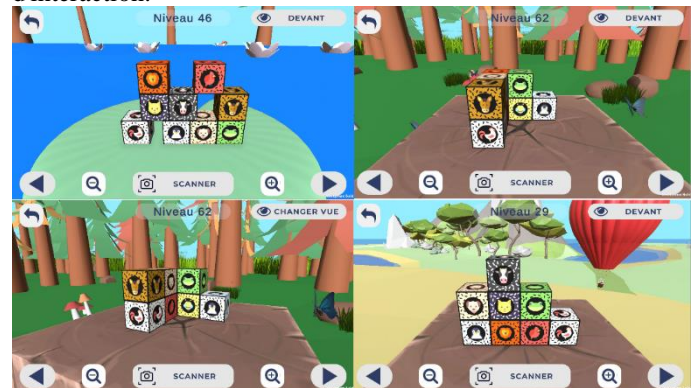
Figure 3. Interface du jeu ludique accompagnant les exercices physiques

pièces, les scénarii d'utilisation avec tablette, et les modes d'interaction.