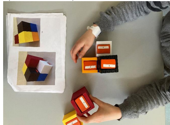
Figure 1. Jeu de construction intégrant des capteurs inertiels