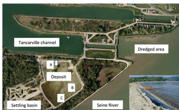
Figure 1 – Situation de la chambre de dépôt

inhiber la croissance des plantes si le drainage manque.